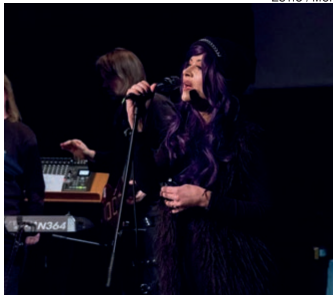
Dla WOŚP zagrał skoczowski zespół Batalion d'Amour.