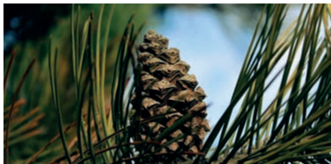
Wydział Gospodarki Komunalnej i Środowiska

Bliższych informacji na temat aktualnych obowiązków w zakresie usuwania drzew i krzewów z terenu nieruchomości uzyskać można w Wydziale Gospodarki Komunalnej i Środowiska Urzędu Miejskiego w Skoczowie, Rynek 1, pok. 21 (tel. 33 853 38 54 wew. 142).