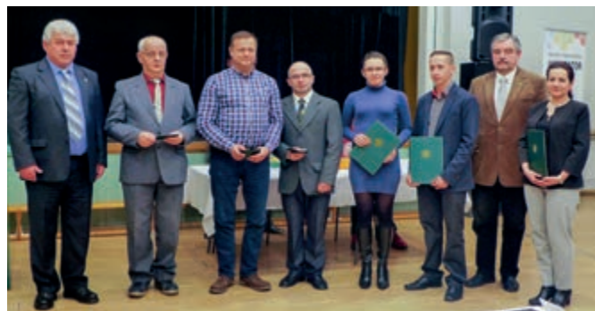
Na walnym zebraniu członkowie skoczowskiego PTTK odebrali przyznane przez władze Koła wyróżnienia i odznaczenia.