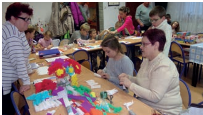
Zajęcia zorganizowane w czasie ferii zimowych przez radę osiedla „Za Wisłą”