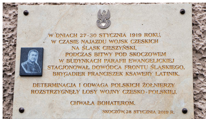
Pamiątkowe tablice na budynku Szkoły Podstawowej nr 1 w Skoczowie (po lewej) oraz na budynku parafii ewangelickiej (po prawej)