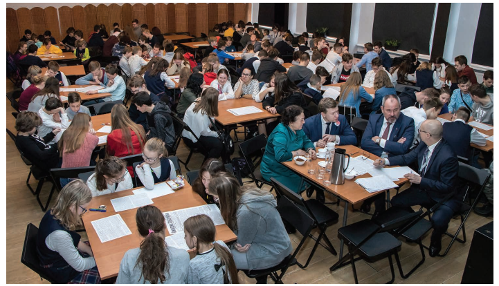
Konferencja edukacyjna dla młodzieży gminy Skoczów

re poprzedniego dnia zostało postawione przez Miejski Zarząd Dróg w Skoczowie specjalnie z tej okazji, by „zagrać” podczas odtwarzanych działań bojowych sprzed wieku, czyli... spektakularnie sponąć! Mieli też okazję przyjrzeć się haubicy z czasów I wojny światowej, która do Skoczowa przybyła aż z Poznania.