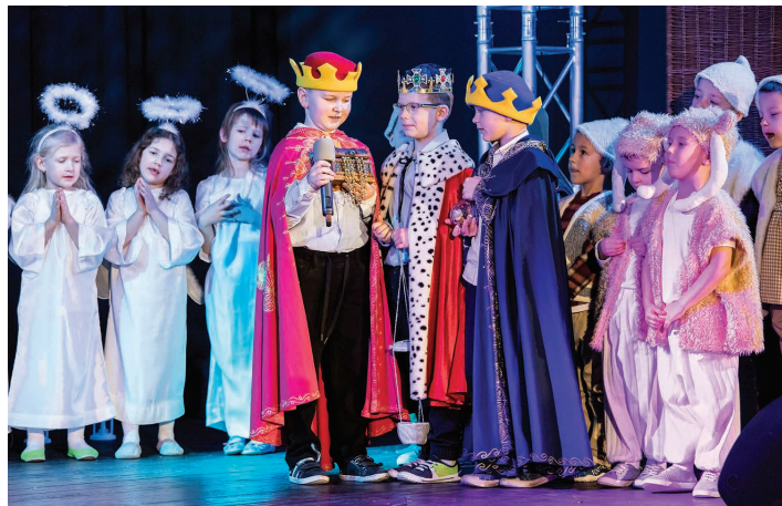
Fot. Rafał Raszka