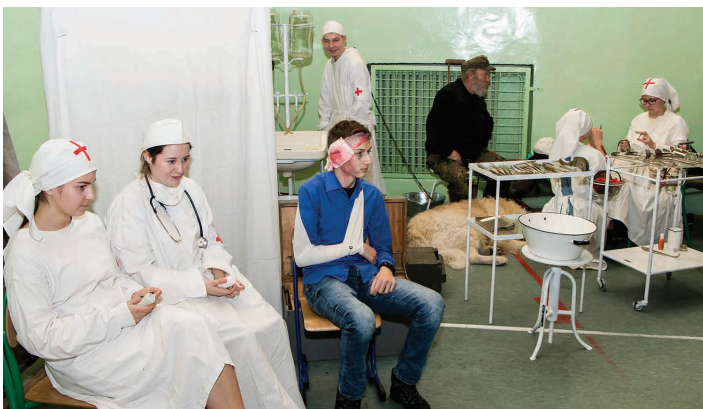
Rekonstrukcja historyczna szpitala polowego w sali gimnastycznej SP1