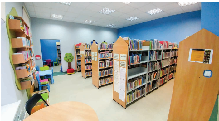
Oddział dla dzieci i młodzieży oraz Czytelnia książek i czasopism po II etapie modernizacji placówki, przeprowadzonym w 2018 r. Zdjęcia z archiwum biblioteki

Artykuł opublikowany w „Kalendarzu Miłośników Skoczowa 2019”. Część historyczna została opracowana na podstawie Kroniki biblioteki prowadzonej w latach 1969-1991.