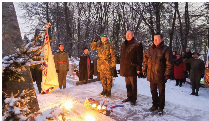
Złożenie kwiatów przez delegację czeskiego MSZ, MON i czeskich żołnierzy