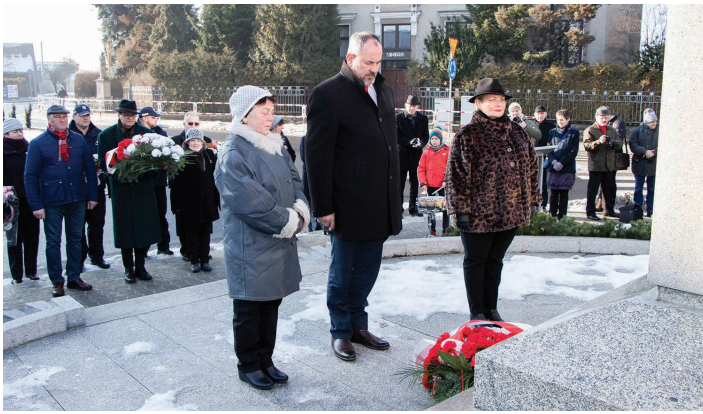
Złożenie kwiatów pod pomnikiem Naszym Bohaterom