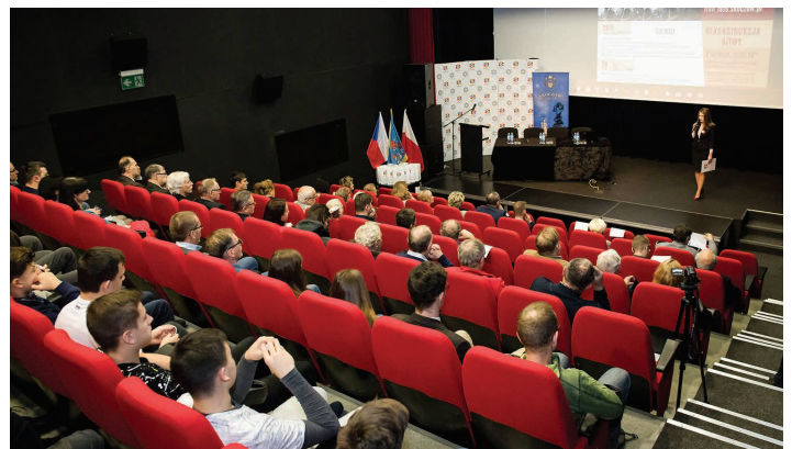
Konferencja naukowa w Teatrze Elektrycznym.