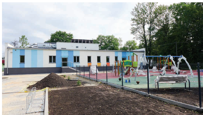
Przedszkole w Pierścću dosłownie „rośnie w oczach”!

przedszkolaki będą brać udział w projekcie „Nowe perspektywy Przedszkola Publicznego w Pierścću”. W jego ramach sala dla najmłodszych zostanie wyposażona w dodatkowy sprzęt dydaktyczny, instrumenty muzyczne oraz zabawki. Dzieci będą brały udział w zajęciach z doświadczania świata, arteterapii, muzykoterapii, dogoterapii, teatralnych, logopedycznych, integracyjno-adaptacyjnych oraz gimnastyki korekcyjnej. Pojawiają się też dodatkowe zajęcia dla nauczycieli przedszkola z zakresu prowadzenia zajęć artystycznych. To wróży jeszcze lepsze rozwijanie potencjału w zakresie występów dzieci z wykorzystaniem pieśni