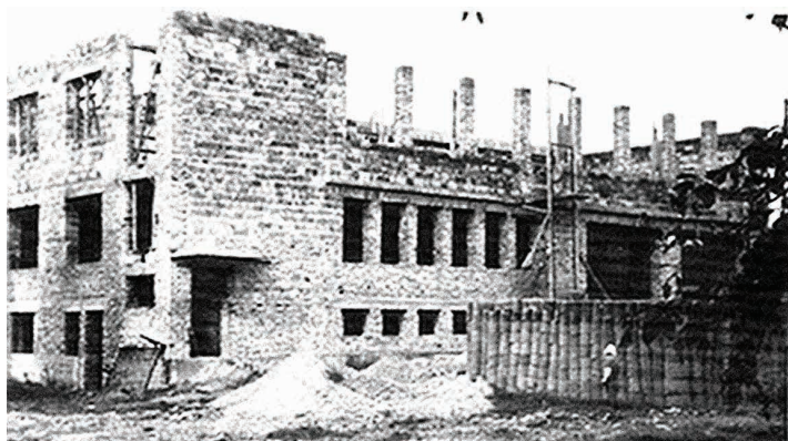
Nowa remiza w budowie – 8 lipca 1979 r.