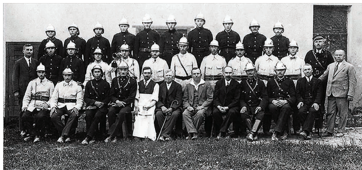
Uroczystość położenia kamienia węgielnego pod remizę (czerwiec 1929 r.)

Podczas pisania o dziejach OSP w Międzyświeciu nasuwa się powiedzenie, że „historia zatacza koło”. W 1921 roku, w pierwszych latach niepodległości międzywojennej Polski, kilku mieszkańców Międzyświecia założyło we wsi OSP. Postawili sobie za cel nie tylko walkę z żywiołem, ale również krzewienie ducha polskości.