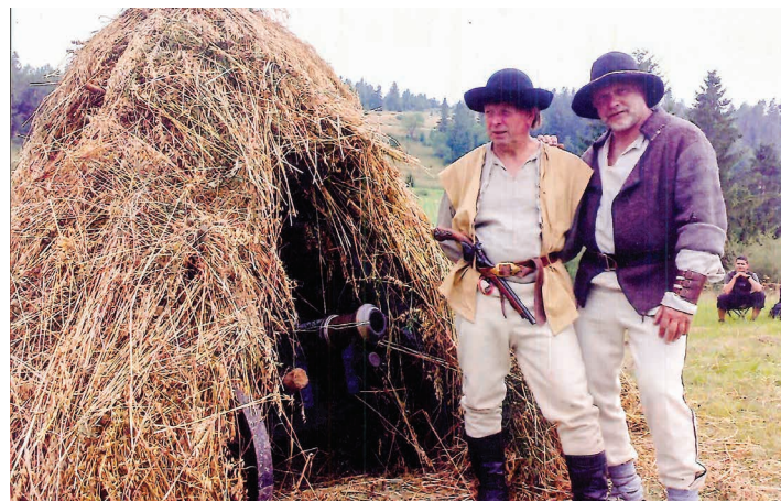
Na planie „Janosika”.