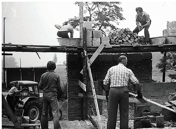
Budowa drugiej remizy

w okolicznych OSP oraz 20 miejscowych. Nowa strażnica przywróciła życie kulturalne na wsi. Oprócz samego funkcjonowania jednostki pożarniczej, która utworzyła nawet Młodzieżową Drużynę Pożarniczą z uczniów Szkoły Rolniczej, w strażnicy odbywały się wesela, zebrania gromadzkie, a także zebrania Kółka Rolniczego i Koła Gospodyń Wiejskich. W kolejnych latach jednostka funkcjonowała normalnie. Udało się nawiązać dobrą współpracę ze Szkołą Rolniczą i utworzyć żeńską drużynę pożarniczą składającą się z uczennic szkoły. W remizie odbywały się też bale organizowane przez panie z KGW, z których dochody pozwalały opłacić ogrzewanie