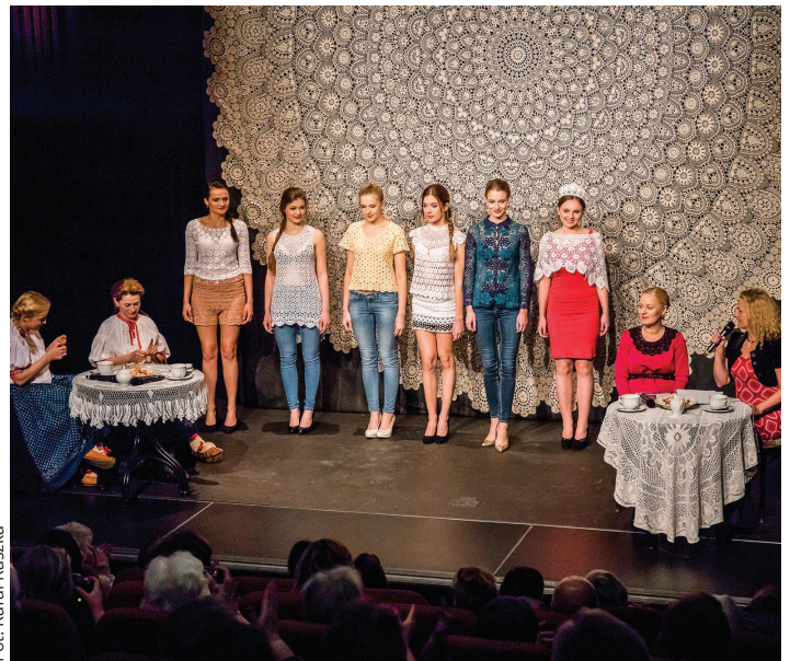
Fot. Rafał Raszka