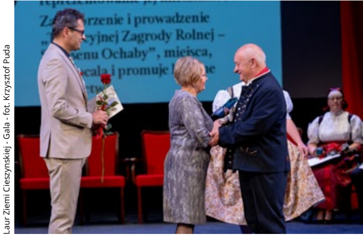
Laur Ziemi Cieszyńskiej - Gala

– To temat bardzo trudny. Sprawy rowów i cieków wodnych powinny być w dużej mierze domeną Wód Polskich. Tymczasem często musimy dokładać do tego środki samorządowe, które mogłyby trafić na drogi czy kulturę. Są jakieś drobne postępy, ale to wciąż temat niezamknięty.