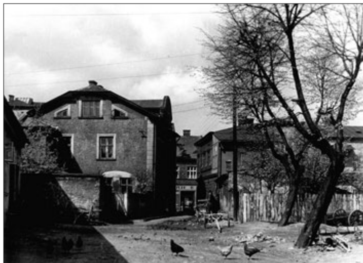
Fot. Leon Para (konkurs grudzień). Z archiwum Towarzystwa Miłośników Skoczowa

Wyniki: W listopadowym numerze ukazało się zdjęcie, na którym uwieczniona została ulica dojazdowa do ul. Targowej 24 – od