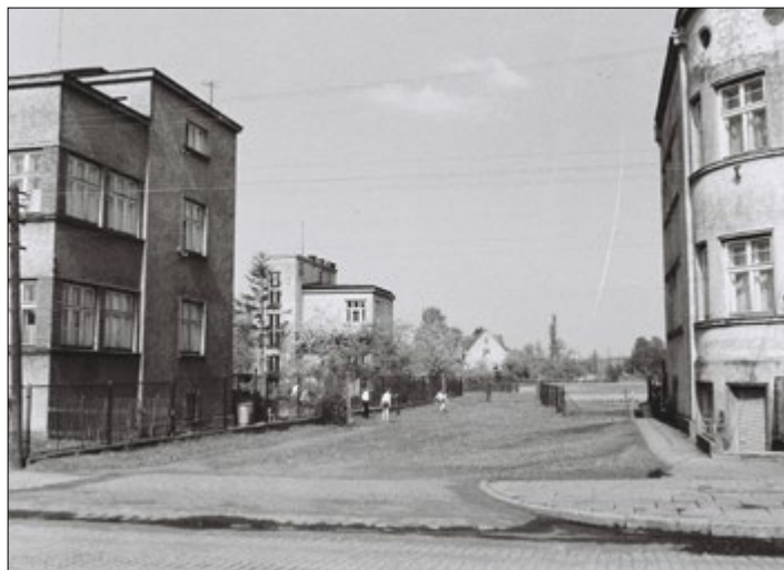
Fot. Leon Para (konkurs listopad). Z archiwum Towarzystwa Miłośników Skoczowa

Wyniki: We październikowym numerze ukazało się zdjęcie, na którym uwieczniona została szkoła ewangelicka (1960 rok) – przy ul. Zofii Kossak-Szatkovskiej. Do konkursu w wyznaczonym ter-