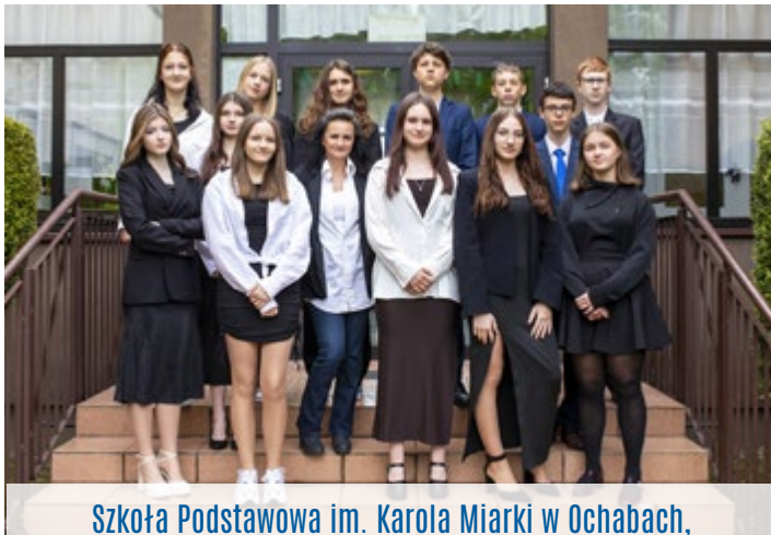
Szkoła Podstawowa im. Karola Miarki w Ochabach, klasa 8a