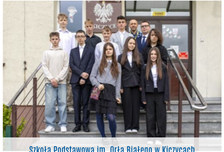
Szkoła Podstawowa im. Orła Białego w Kiczycach