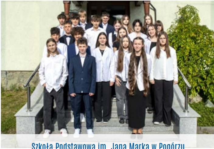
Szkoła Podstawowa im. Jana Marka w Pogórze