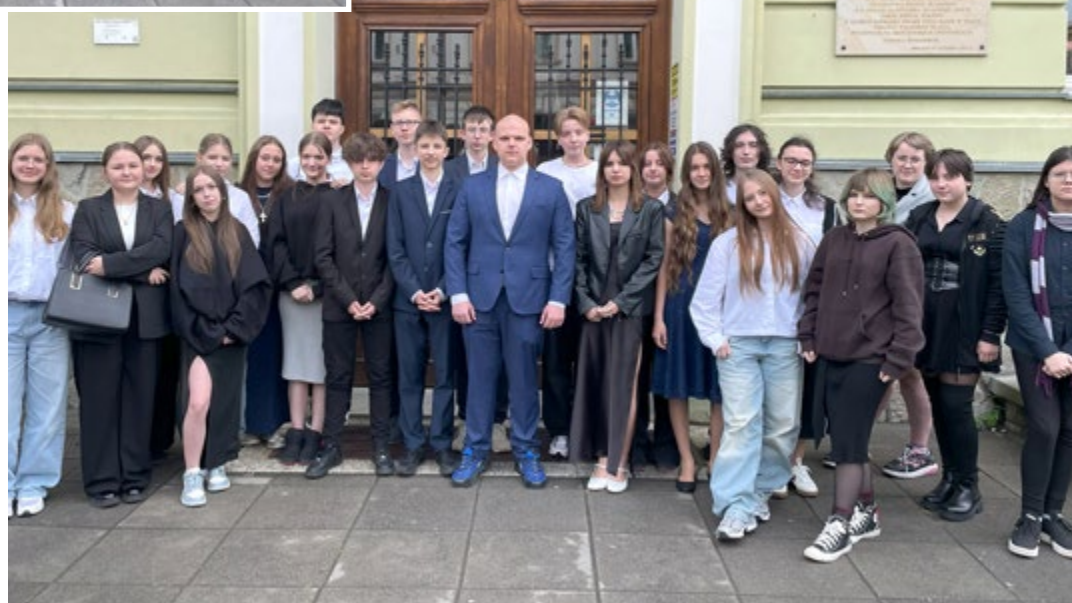
Fot. Klasa 8b.