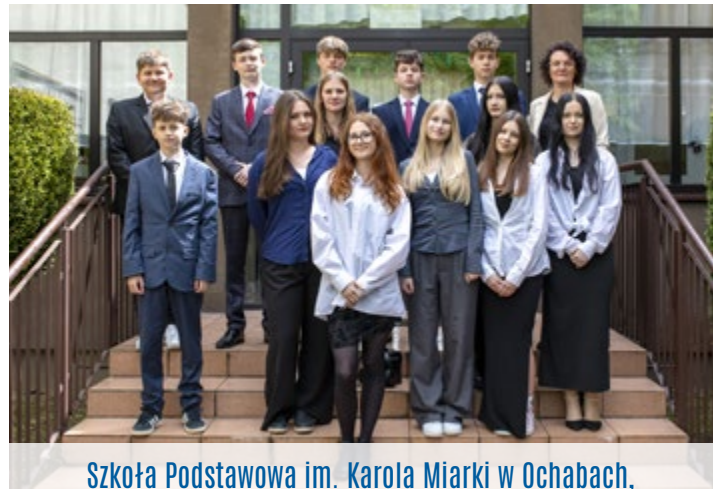
Szkoła Podstawowa im. Karola Miarki w Ochabach, klasa 8b