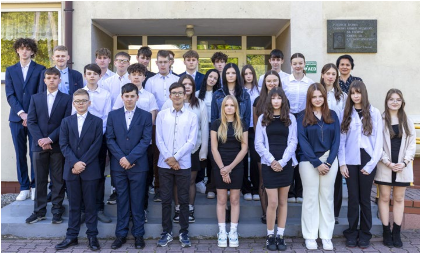
Szkoła Podstawowa im. Zofii Kossak w Pierścicu