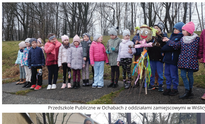
Przedszkole Publiczne w Ochabach z oddziałami zamiejscowymi w Wiślicy