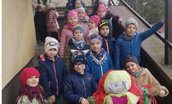
Przedszkole Publiczne w Pogórze