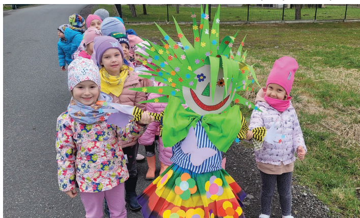
Przedszkole Publiczne w Kiczycach