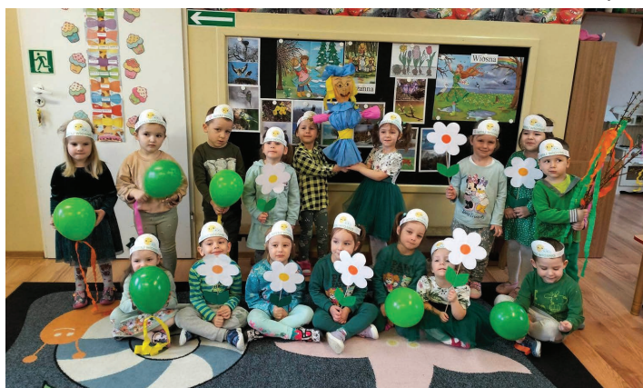
Przedszkole Publiczne w Pierścu z oddziałami zamiejscowymi Kowalach