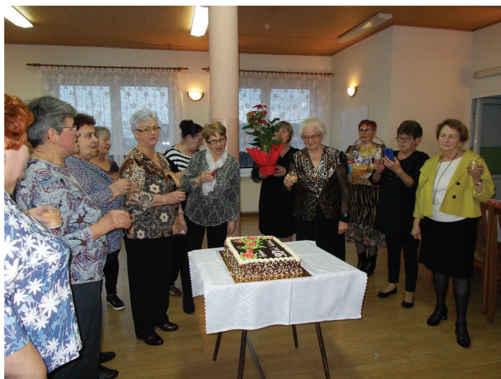
Obchody Dnia Kobiet w Kowalach. Fot. KGW Kowale

Panie zrobiły także kilka stroików, które zostały przekazane na charytatywne aukcje i zasilają konta fundacji chorych dzieci: Szymonka, Bartoszka i Dorotki. (M. Szyndler/WP)