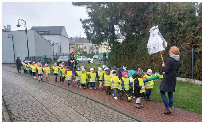
Przedszkole Publiczne nr 1 w Skoczowie

nauki wierszy, piosenek, wiosennych prac i dekorowania sali. W wielu przedszkolnych placówkach pojawiły się kolorowe Marzanny, gaiki, a nawet postać „pani Wiosny”. Dzieci, ubrane w wiosenne barwy, obchodziły pierwszy dzień wiosny na wesoło – bawiły się, śpiewały piosenki, recytowały wiersze związane oczywiście z nową porą roku czy prezentowały swoje umiejętności w przedstawieniach. Poniżej zamieszczamy, przesłane do nas, zdjęcia przedszkolaków – barwnie i wesoło witających wiosnę. (WP)