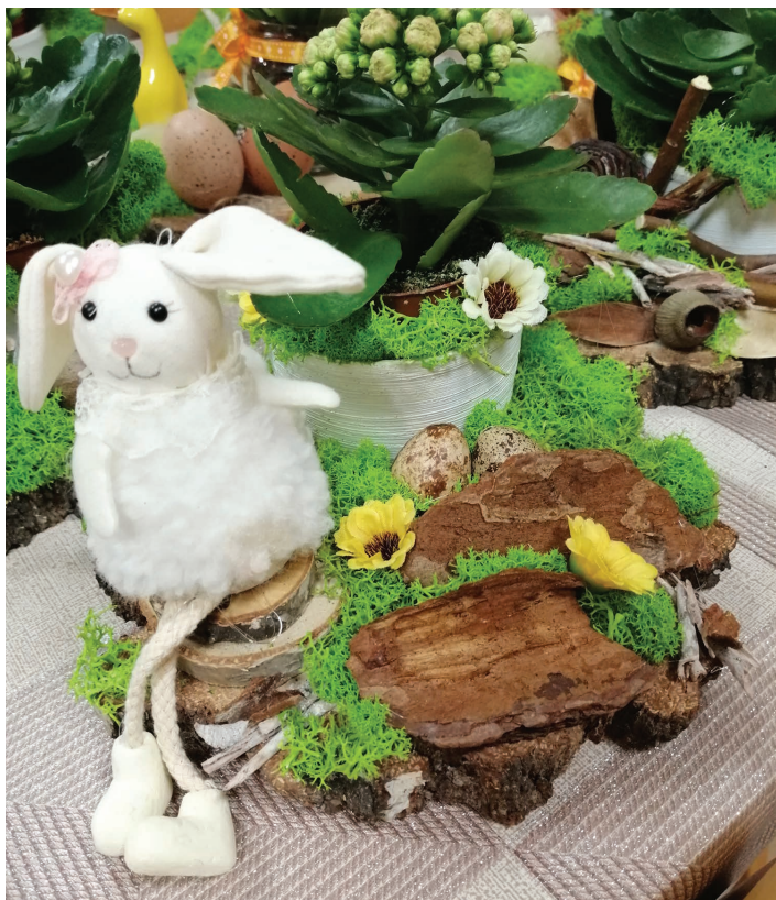
Jedna z prac stworzona na warsztatach florystycznych w Pierścicu.