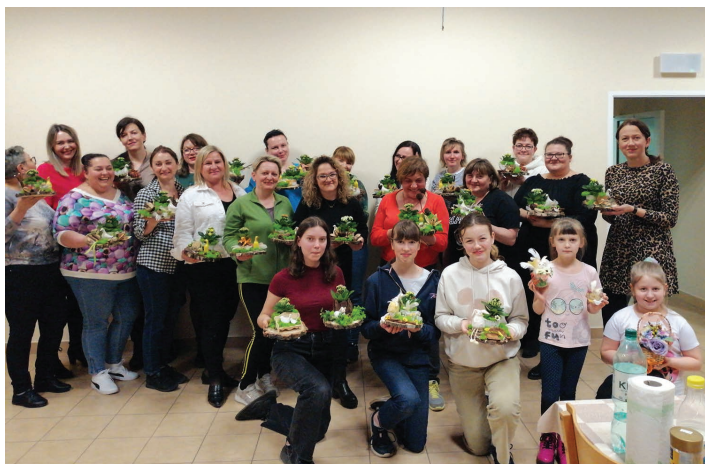
Uczestniczki warsztatów florystycznych w Pierścicu.