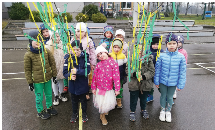
Przedszkole Publiczne w Harbutowicach