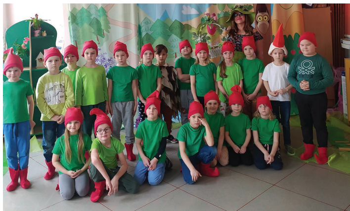
Przedszkole Publiczne nr 4 w Skoczowie z oddziałami zamiejscowymi w Międzywiciu