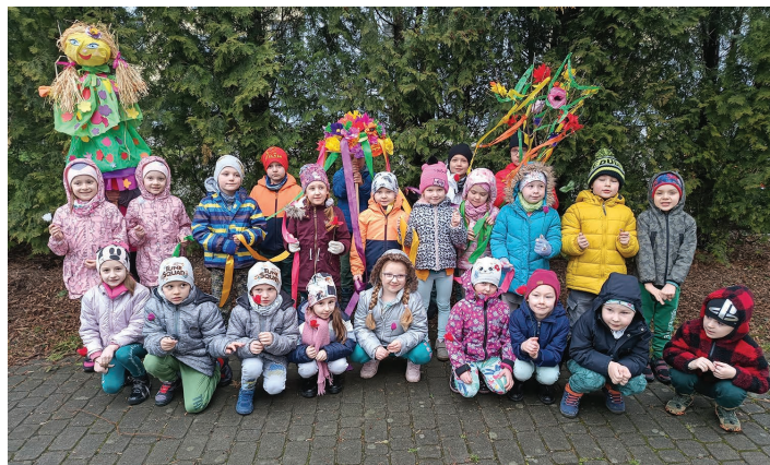
Przedszkole Publiczne nr 2 w Skoczowie