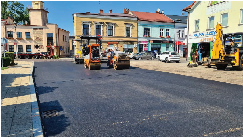
Remont nawierzchni na ul. Mały Rynek w Skoczowie.

Nowe nakładki położono już na ulicach: Tokarskiej w Pogórze, Kolonijnej i Podbór w Ochabach, Kępa w Wiślicy, Przelotowej w Bładnicach, Wesołej w Kiczycach, Mały Rynek i Garbarskiej w Skoczowie, Olchowej w Kiczycach, bocznej od ul. Beskidzkiej w Międzywiciu, Zamek w Pogórze, Wiatrów w Kowalach i Leśnej w Skoczowie. Re-