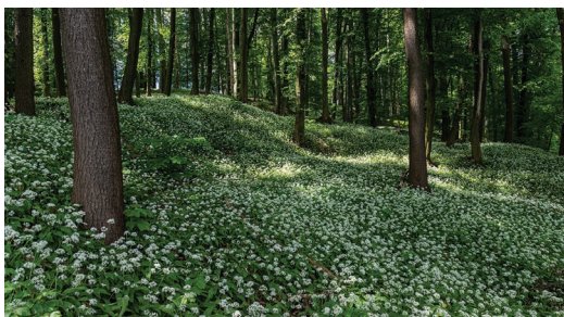
Czosnek niedźwiedzi, Ochaby Małe.

Nad naszymi głowami wieczorami swoje loty rozpoczyna chrabąszcz majowy, który w dzień ukrywa się między liśćmi drzew i krzewów. Są to bardzo ciekawe i piękne owady, należy jednak pamiętać, że są uważane za szkodniki upraw, trawników i szkółek, zarówno jako imago (postać dorosła), jak i larwa. Na łąkach pszczoły mają pełne „ręce” roboty, a nad wodą gwarminie mija czas żabom z rodziny kumakowatych, ponieważ rozpoczynają się ich gody. Gody ma także jaszczurka zielona i żmija zygzakowata. W maju kończą się też przyloty ptaków. Jako jeden z ostatnich z Afryki powraca jerzyk – to znak, że wiosna już na dobre objęła panowanie nad przyrodą. Duża część ptaków odbyła już tuki, wiele wysiaduje jaja. Należy pamiętać, że ptakom należy się w tym czasie cisza i spokój, wystraszone mogą opuścić gniazdo w następstwie czego lęg nie przetrwa. Część ptaków karmi już swoje pisklęta, choć czasem nie do końca „swoje”, bo przecież w maju kukułka zaczyna podrzuczać jaja do