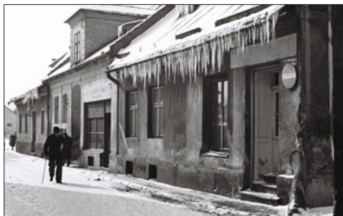
(konkurs luty)