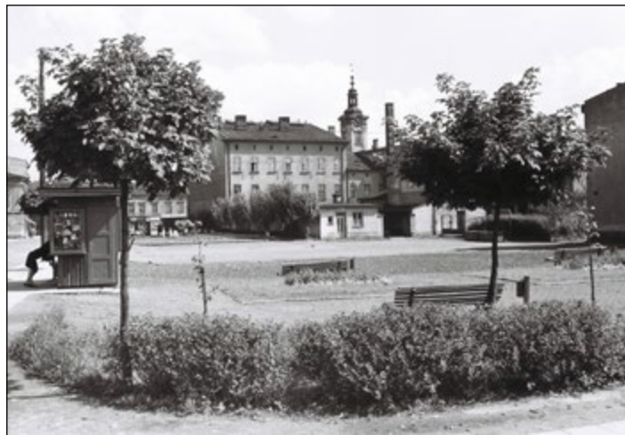
Fot. Leon Para (konkurs marzec)