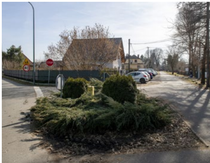
Skrzyżowanie ul. Głównej ze ślepą ulicą Krzempka - przy SP w Ochabach.

Dzięki staraniom gminy Skoczów będzie mogła ruszyć kolejna inwestycja w gminie Skoczów! Otrzymaliśmy aż 100% dofinansowania z Rządowego Funduszu Rozwoju Dróg na przebudowę i budowę ul. Krzempka w Ochabach Małych. Wartość prac to 2 411 255 zł.