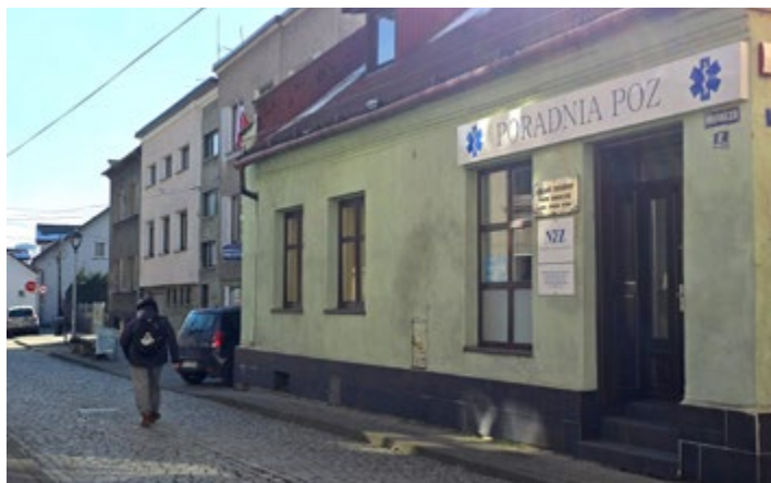
Zdjęcie wykonane przez Tadeusza Popiela.