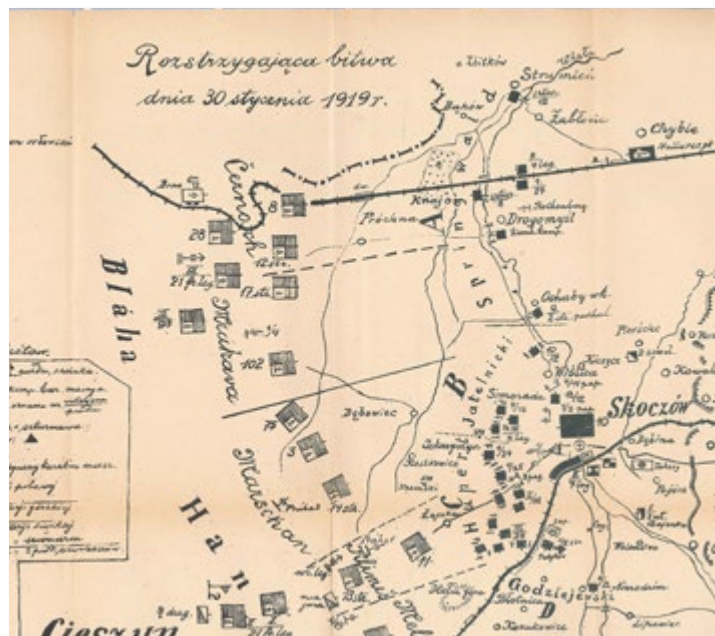
Źródło: Franciszek Ksawery Latinik, „Walka o Śląsk Cieszyński, w R. 1919”.

Wobec nieudanych prób sforsowania polskich pozycji, tego dnia wieczorem do polskiego sztabu przybyli czescy emisariusze