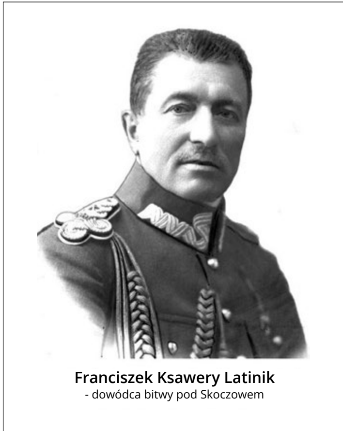
Franciszek Ksawery Latinik - dowódca bitwy pod Skoczowem

W historii Skoczowa nie brak wydarzeń i momentów, które w dziejach miasta, a nawet całego regionu Śląska Cieszyńskiego zapisały się złotymi zgłoskami. Wśród nich nie sposób nie wymienić Bitwy pod Skoczowem, która miała miejsce w dniach 28-30 stycznia 1919 r.