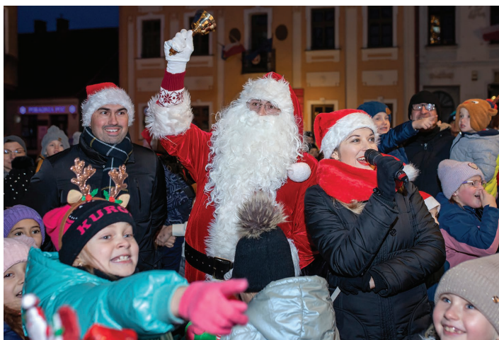
Fot. z archiwum MCK

Tegoroczne Mikołajki przyniosły dziesiątkom dzieci wiele radości. Ci całkiem mali, nieco starsi, a nawet dorosłe osoby 6 grudnia bawiły się świetnie na skoczowskim rynku, mimo niesprzyjającej aury pogodowej. Nie brakowało słodkości zapewnionych przez lokalną Firmę Ludwig Czekolada oraz Stołówkę „Maję”. W drugim przypadku chodzi oczywiście o niezwykle gęstą, syćącą, przepyszną i gorącą czekoladę do picia, którą częstował organizator wydarzenia - Miejskie Centrum Kultury „Integrator”.