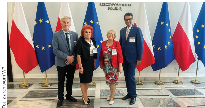
Fot. z archiwum WP

Panie Sołtysie, serdeczne gratulacje! (WP)