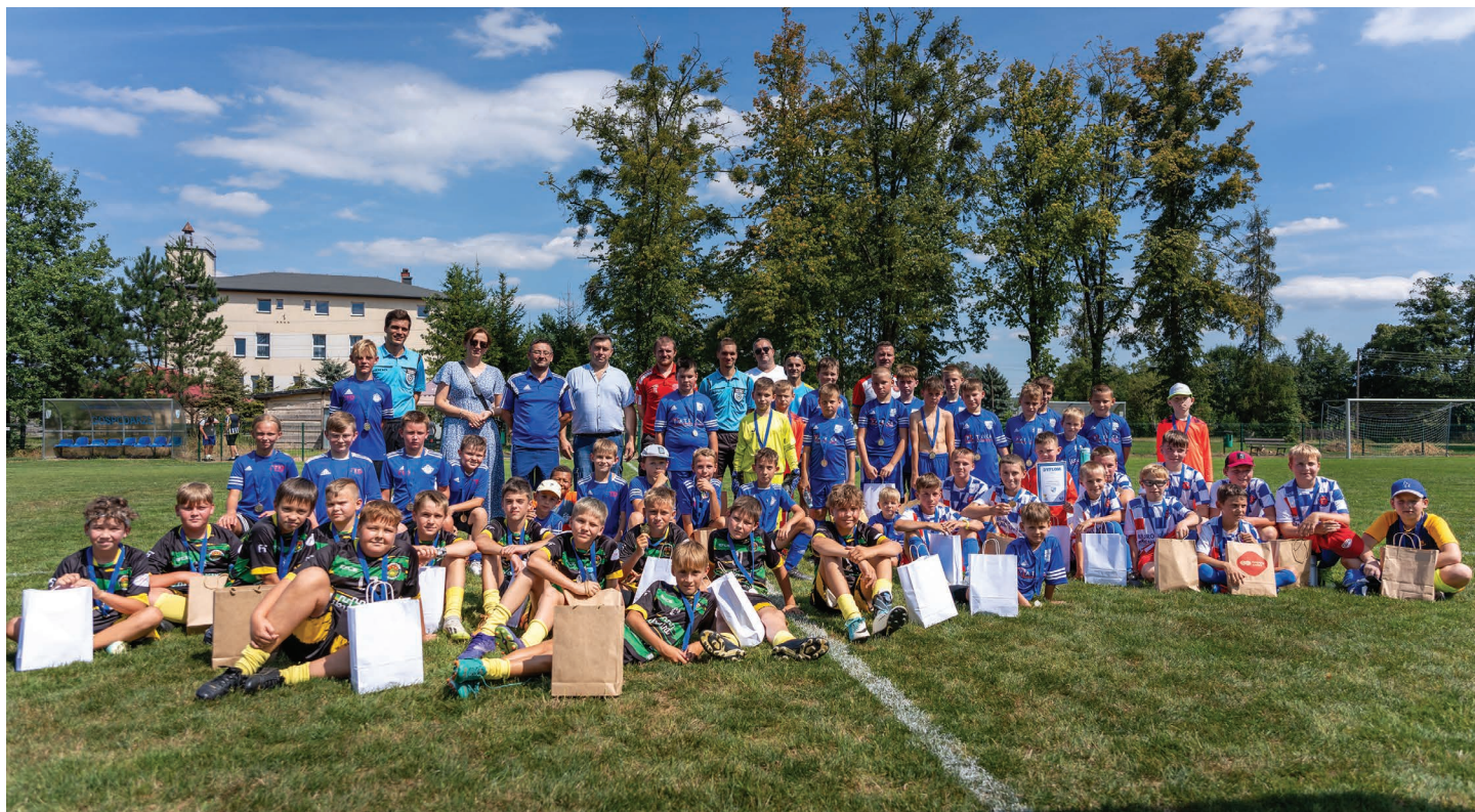
Fot. Michał Augul

Źródło: Oficjalna strona internetowa klubu blekitnypierściec.futbolowo.pl , dostęp na dzień 30.07.2024 r.