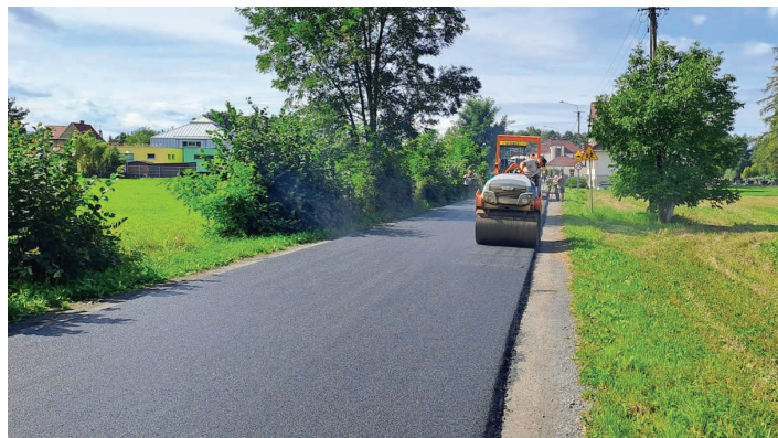
Remont ul. Gołyskiej w Ochabach.