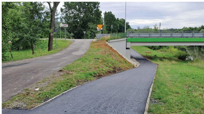
Nowa nawierzchnia na ścieżce pieszo-rowerowej pod mostem w Ochabach

oraz Wiślańska przebiegająca po części w sołectwie Harbutowice i na terenie miasta Skoczów. W budżecie Miejskiego Zarządu Dróg na prace modernizacyjne nawierzchni o łącznej długości ok. 4,7 km zarezerwowano kwotę 2 300 000 złotych. Przypomnijmy, w ciągu poprzednich 4 lat funkcjonowania tzw. funduszu nakładowego na remonty dróg gminnych przeznaczono 8 mln zł, co przełożyło się na 26 km nowego asfaltu w gminie Skoczów. (WP)