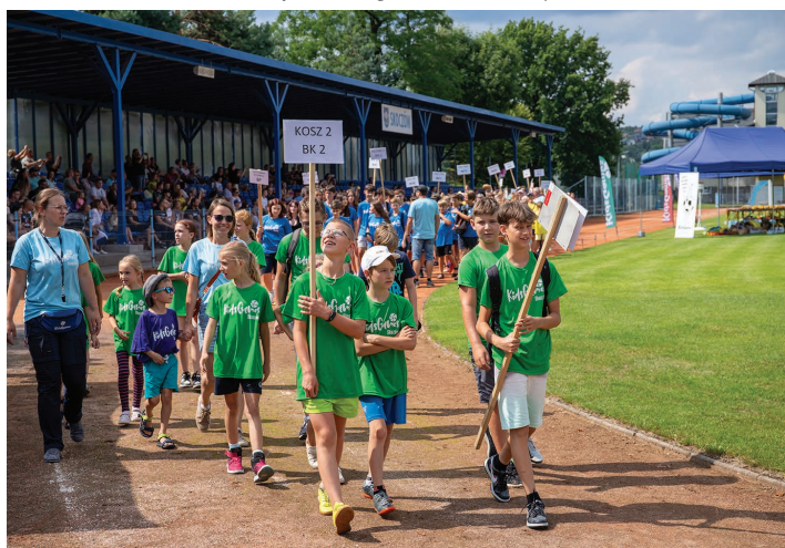
Parada podczas zamknięcia igrzysk.

Przez cały tydzień od 16 do 22 lipca w Skoczowie odbywała się 6. edycja Igrzysk Dziecięcych Kids Games. Dla uczestników tej wyjątkowej półkolonii był to czas pełen wrażeń, odkrywania swoich pasji i rozwoju.