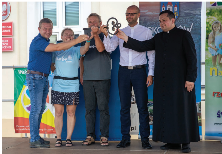
Przekazanie symbolicznego klucza do miasta podczas otwarcia Kids Games