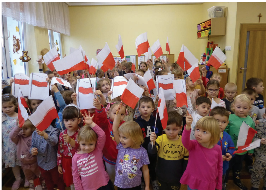
Święto Niepodległości w Przedszkolu Publicznym nr 3 w Skoczowie.

„Szkoła do hymnu” wypadła wspaniale, przedszkolaki, uczniowie, ale również i pedagodzy, spisali się na medal. W placówkach nie tylko uroczyste odśpiewano hymn, ale także przygotowano uroczyste apele. Przedszkolaki ubrane w narodowe barwy, z polskimi flagami i przypiętymi kotylionami włożyły w wykonanie hymnu dużo serca i radości. Również wśród uczniów widać było duże zaangażowanie. Wszystko to potwierdzają krótkie filmy i zdjęcia wykonane podczas akademii, które można było zobaczyć na stronach internetowych przedszkoli i szkół oraz na profilu Gmina Skoczów – Skocz do Skoczowa na Facebooku. (WP)