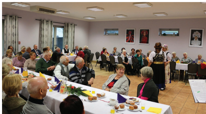
Dzień Seniora w Bładnicach.