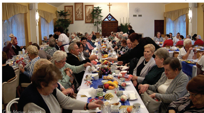
Dzień Seniora w Pogórze.