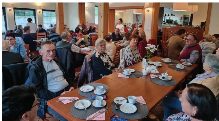
Dzień Seniora na Górnym Borze