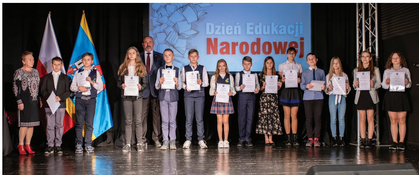
Stypendyści z klas V i VI nagrodzeni za wybitne wyniki w nauce