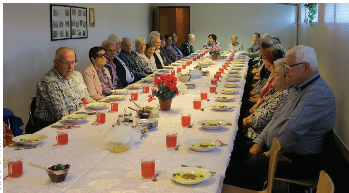
Dzień Seniora w Międzywsiu