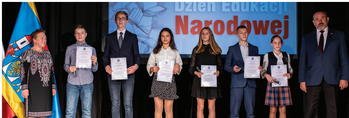
Stypendyści nagrodzeni za wybitne osiągnięcia w dziedzinie: kultury, sportu i laureaci konkursów przedmiotowych i olimpiad