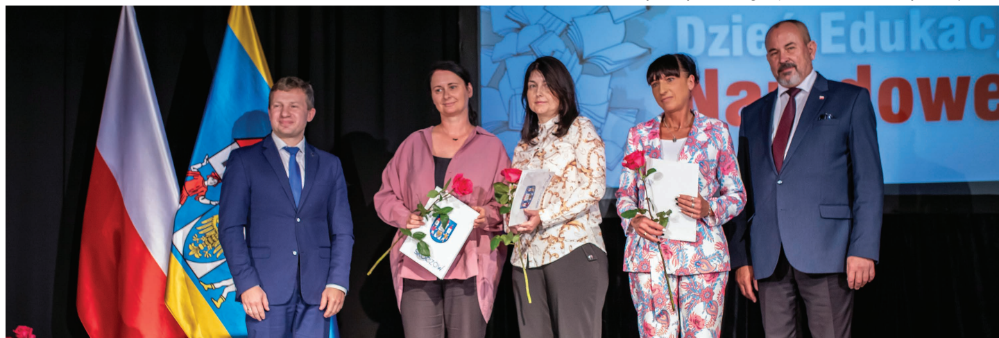
Nauczyciele wyróżnieni nagrodą burmistrza, których uczniowie uzyskali najwyższe wyniki z egzaminu ósmoklasisty w gminie (j. angielski, matematyka, j. polski)