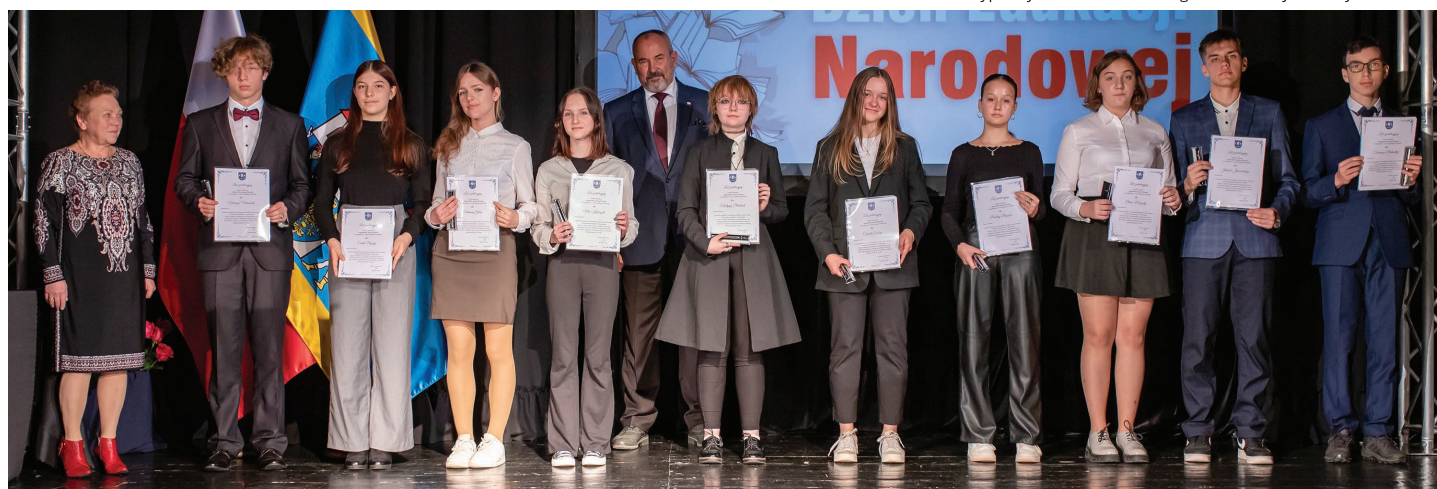
Stypendyści z klas VII i VIII nagrodzeni za wybitne wyniki w nauce