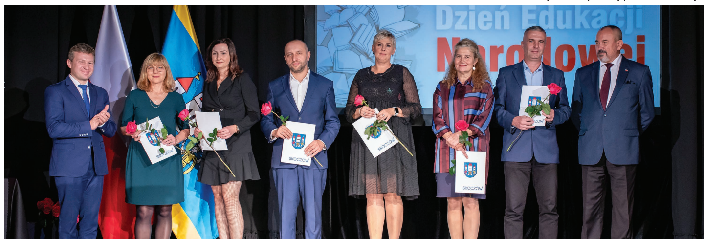
Nauczyciele wyróżnieni nagrodą Burmistrza na wniosek dyrektora placówki