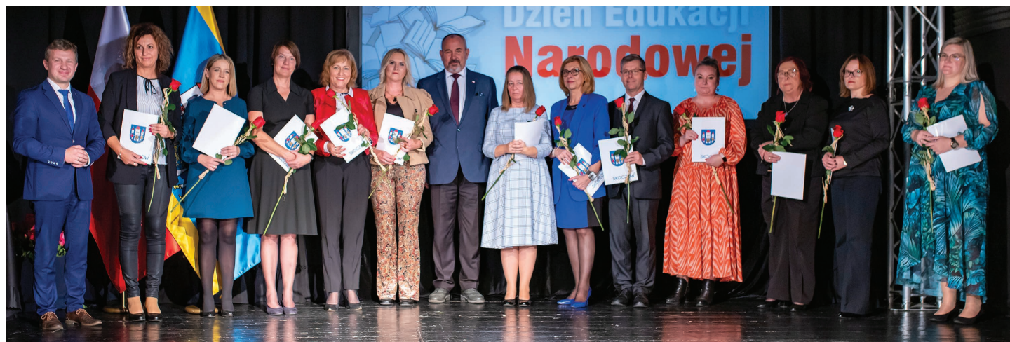
Wyróżnieni dyrektorzy placówek oświatowych