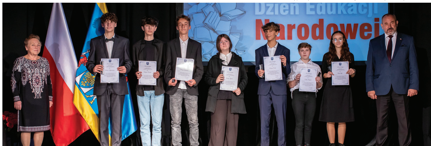
Stypendyści nagrodzeni za najwyższe w gminie wyniki egzaminu ósmoklasisty