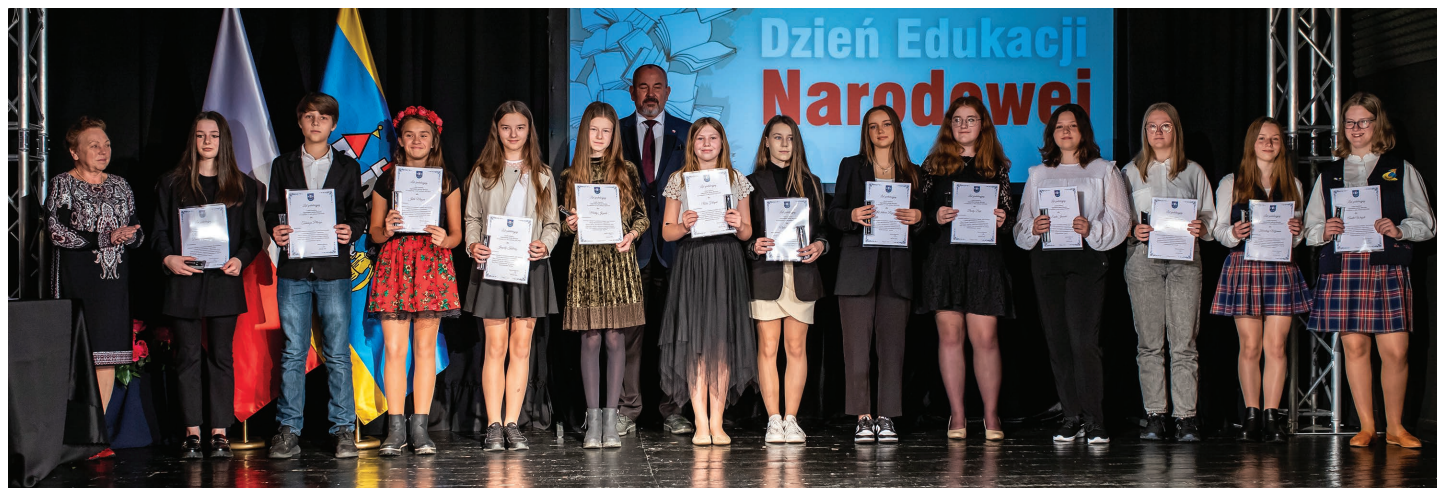
Stypendyści z klas V, VI, VII i VIII nagrodzeni za wybitne wyniki w nauce