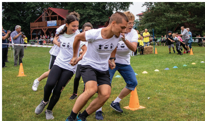
Jedna z konkurencji (na zdjęciu zawodnicy sołectwa Kowale)