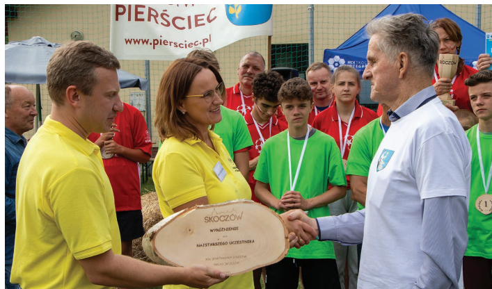
Najstarszy uczestnik Spartakiady