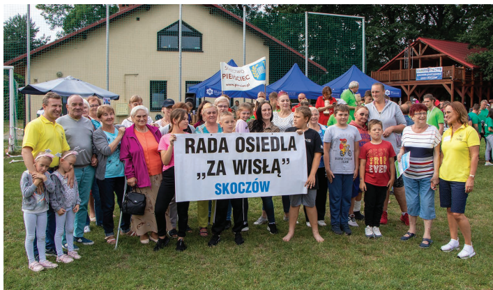
Najliczniejsza reprezentacja – Osiedle „Za Wisłą”