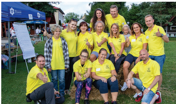
Organizatorzy z zawodnikami – ekipa Urzędu Miejskiego w Skoczowie