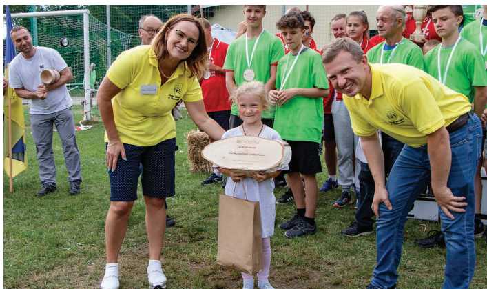
Najmłodsza uczestniczka Spartakiady