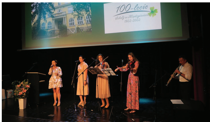
Występ artystyczny absolwentek i uczennic szkoły w Międzyświeciu podczas uroczystej gali