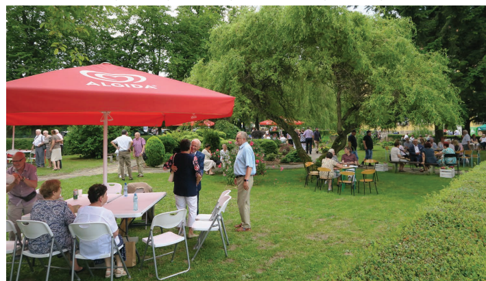
Piknik absolwentów z okazji 100-lecia szkoły. Zdjęcia z archiwum szkoły