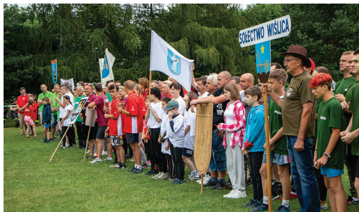
Prezentacja ekip zawodników z sołectw i osiedli Skoczowa. Zdjęcia z archiwum WP