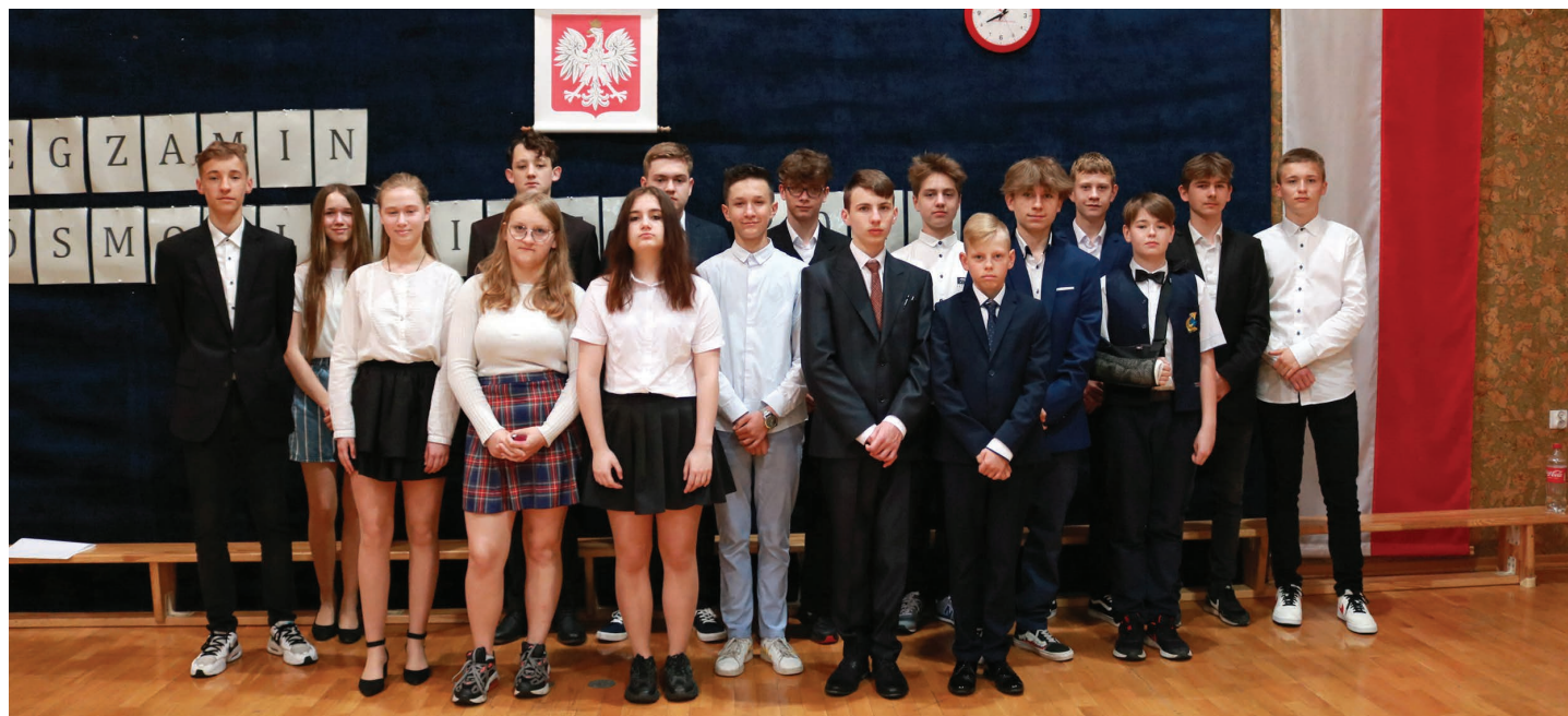
Szkoła Podstawowa nr 3 w Skoczowie