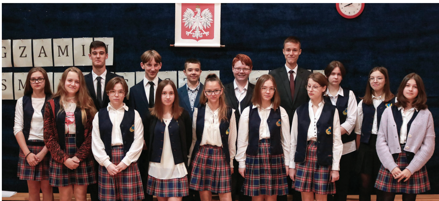
Szkoła Podstawowa nr 3 w Skoczowie