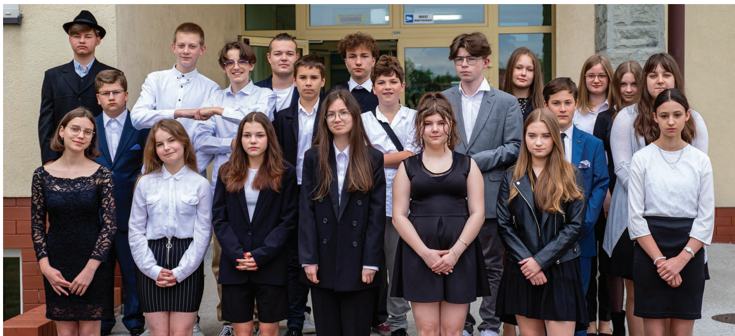
Szkoła Podstawowa im. Zofii Kossak-Szatkovskiej w Pierścicu