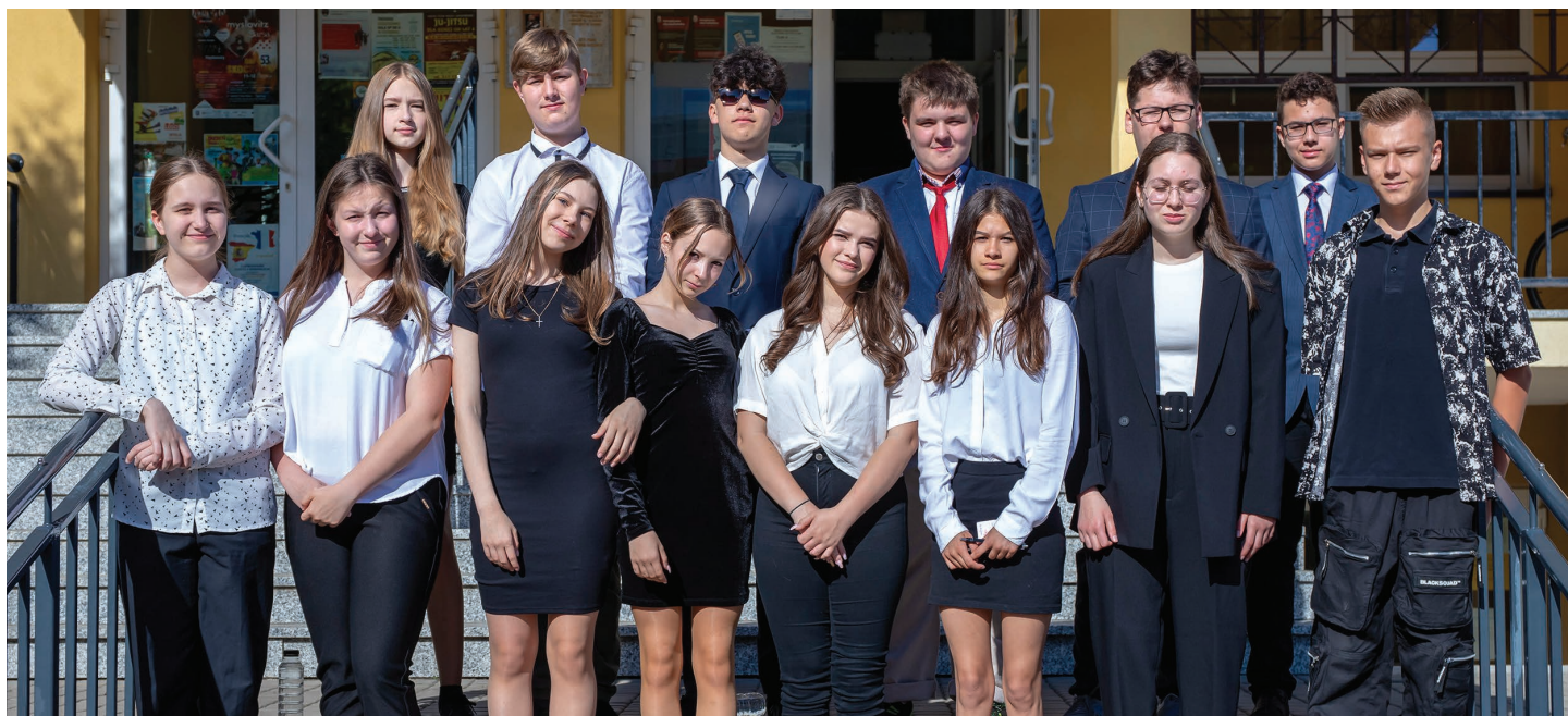
Szkoła Podstawowa nr 8 w Skoczowie