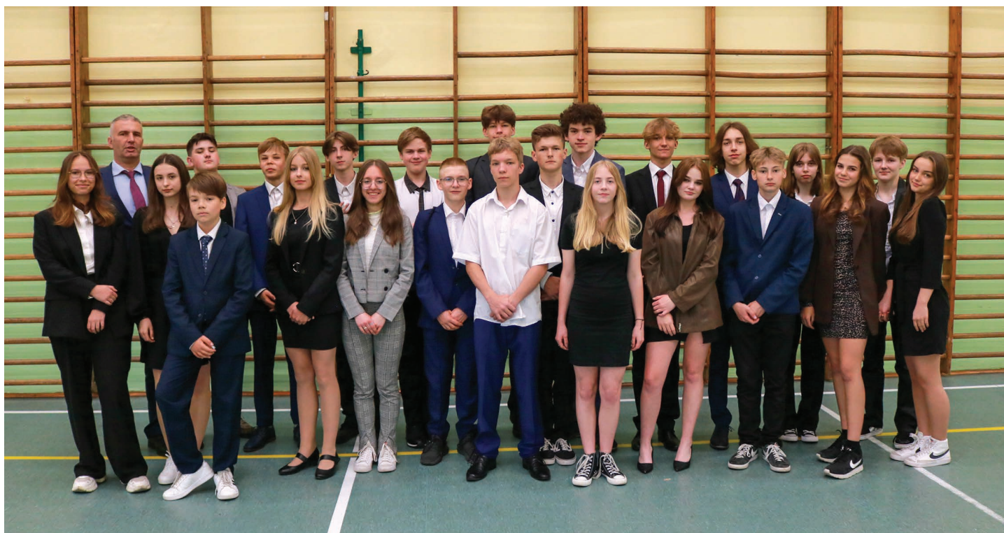
Szkoła Podstawowa nr 1 w Skoczowie