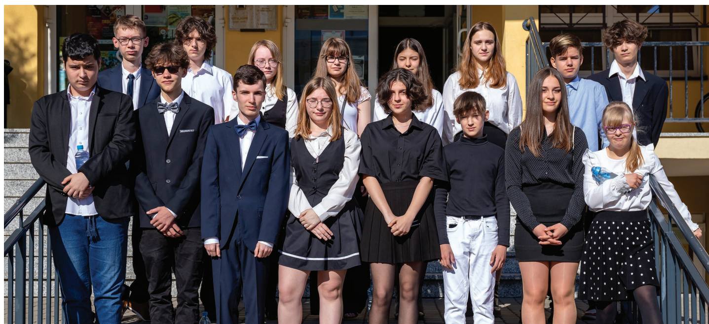
Szkoła Podstawowa nr 8 w Skoczowie