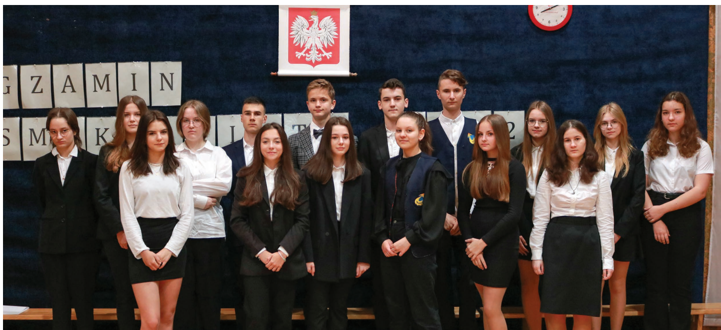
Szkoła Podstawowa nr 3 w Skoczowie