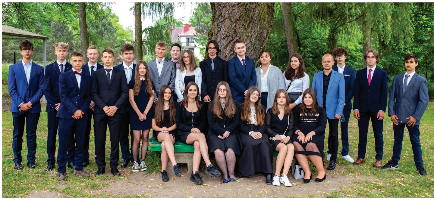
Szkoła Podstawowa im. Karola Miarki w Ochabach