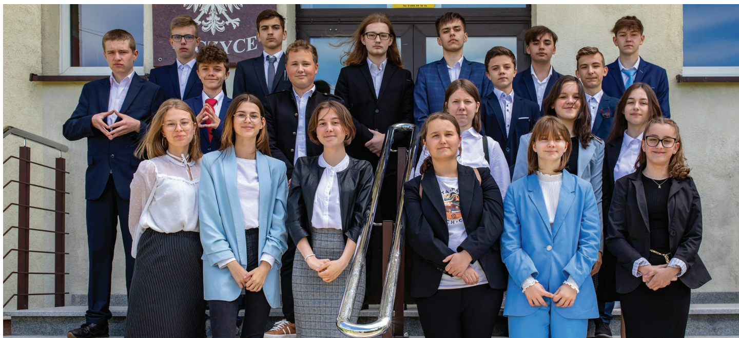
Szkoła Podstawowa im. Orła Białego w Kiczycach