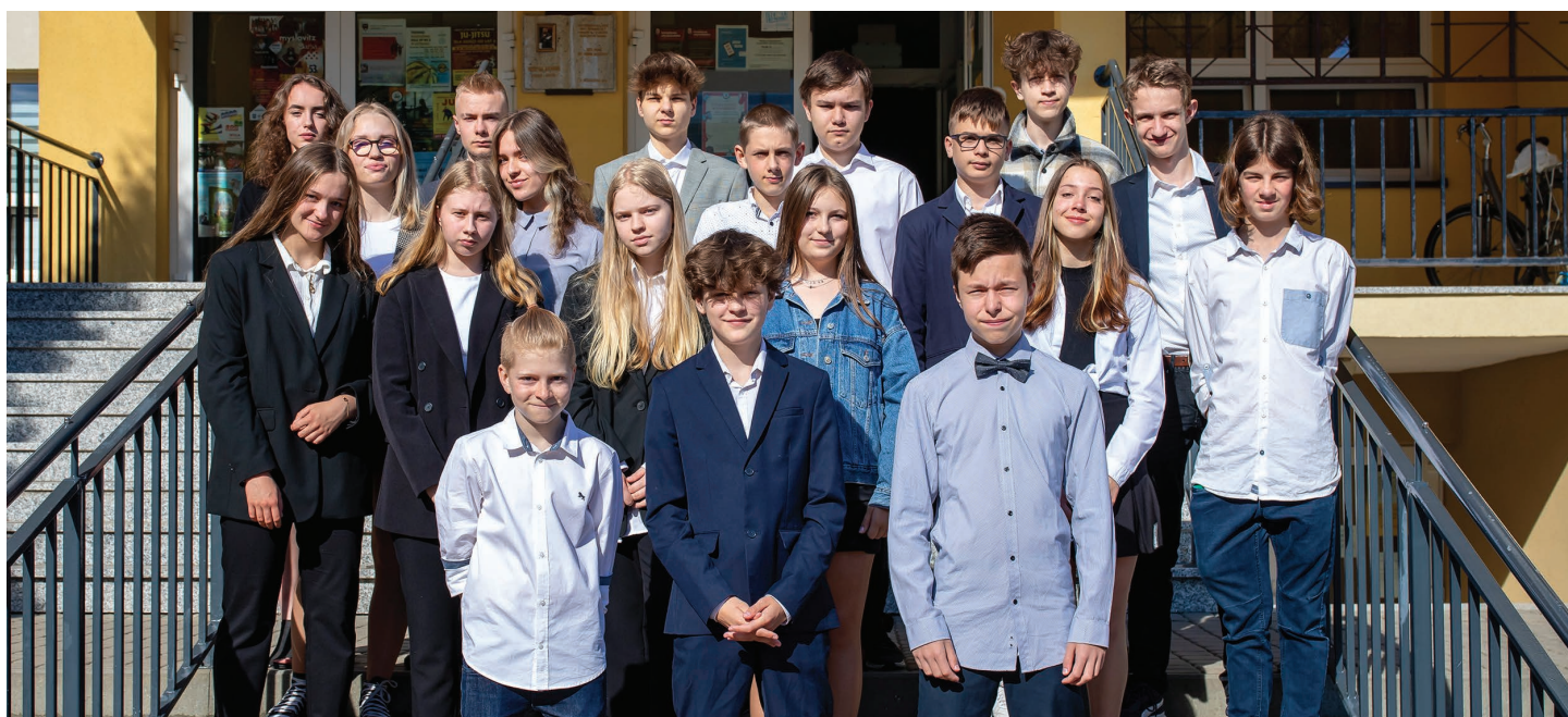
Szkoła Podstawowa nr 8 w Skoczowie