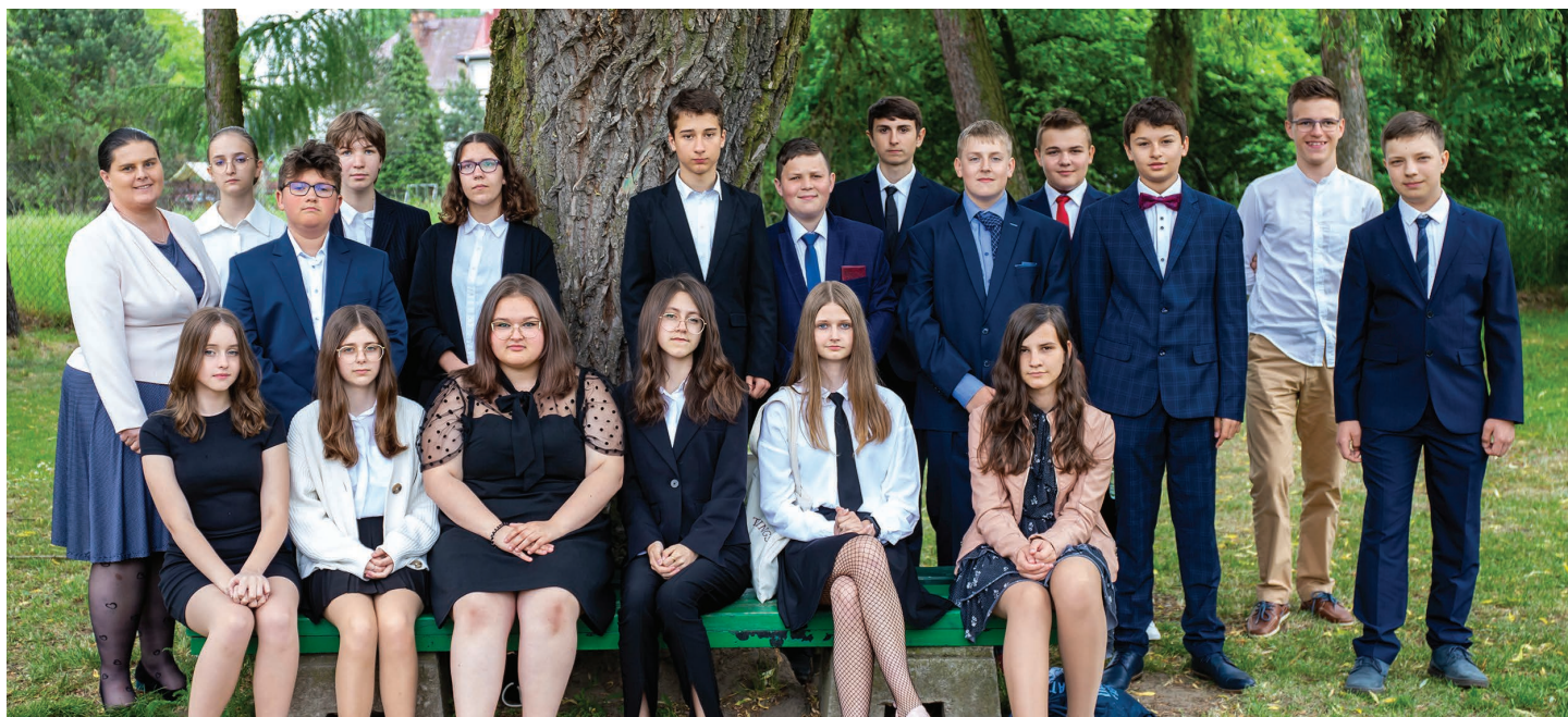
Szkoła Podstawowa im. Karola Miarki w Ochabach