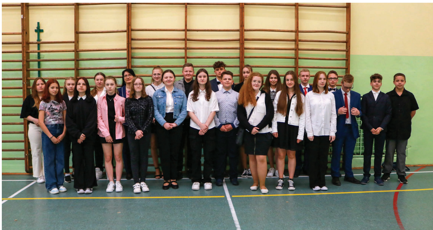
Szkoła Podstawowa nr 1 w Skoczowie