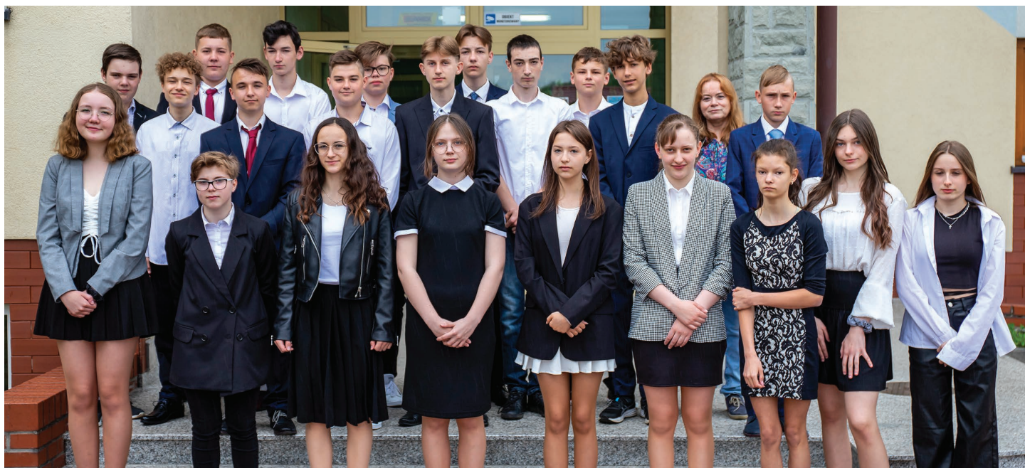
Szkoła Podstawowa im. Zofii Kossak-Szatkovskiej w Pierścicu