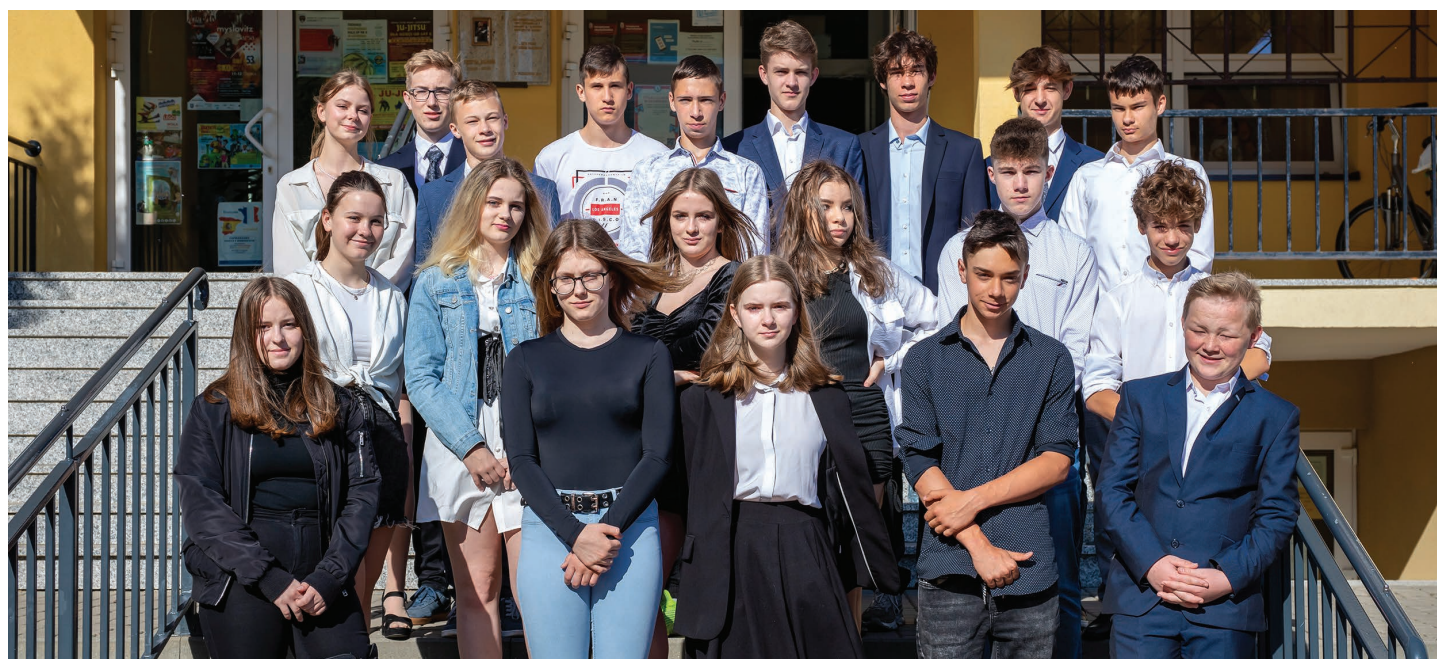
Szkoła Podstawowa nr 8 w Skoczowie