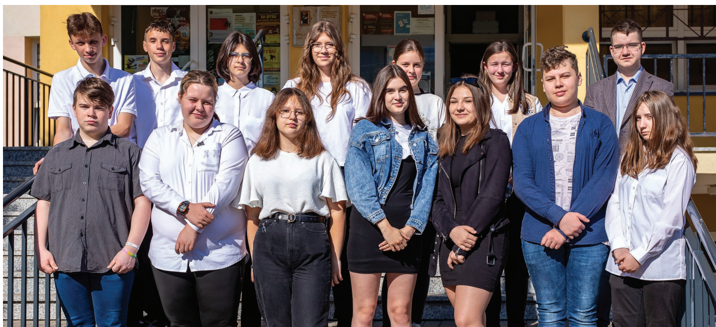
Szkoła Podstawowa nr 8 w Skoczowie