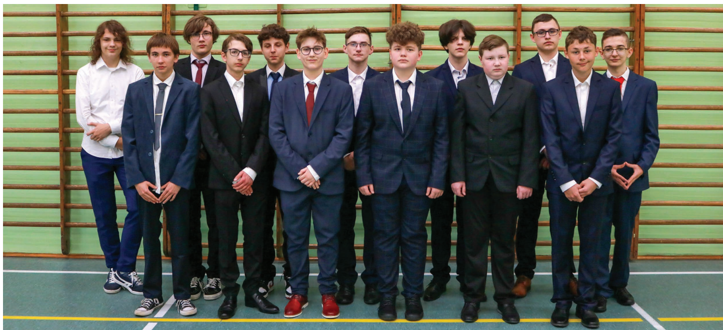
Szkoła Podstawowa nr 1 w Skoczowie