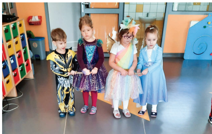
Przedszkole Publiczne w Ochabach