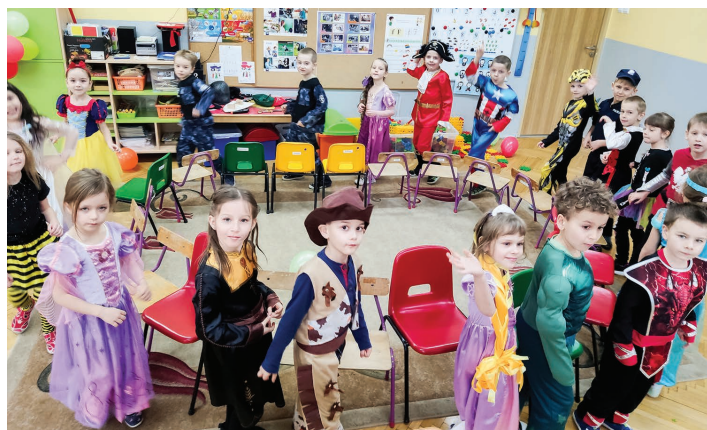
Przedszkole Publiczne nr 3 w Skoczowie