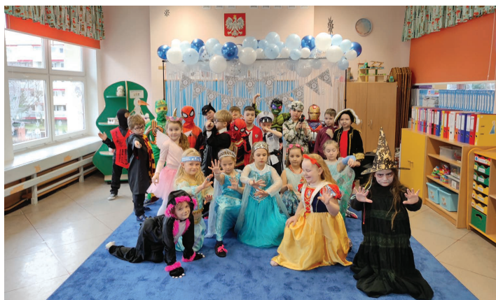
Przedszkole Publiczne nr 4 w Skoczowie