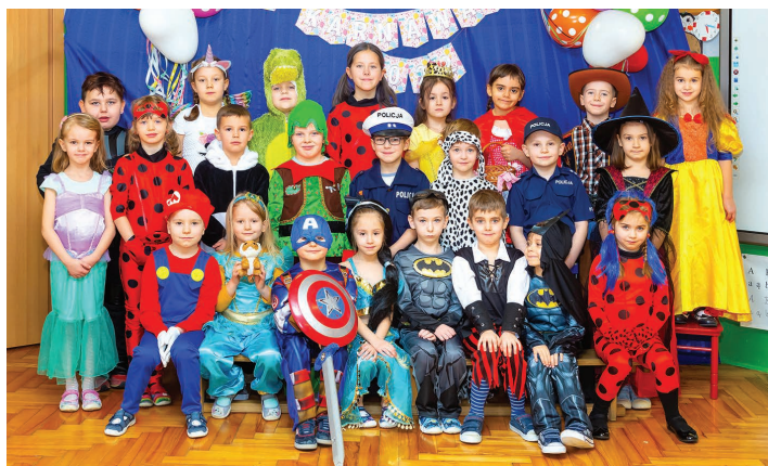
Przedszkole Publiczne nr 2 w Skoczowie