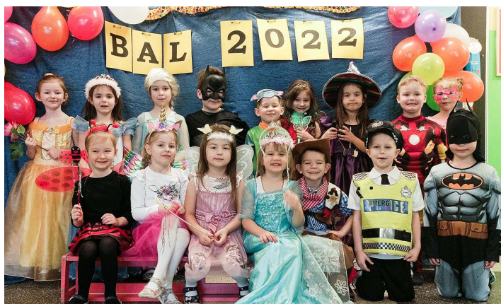
Przedszkole Publiczne nr 4 w Skoczowie z oddziałami zamiejscowymi w Międzywiciu