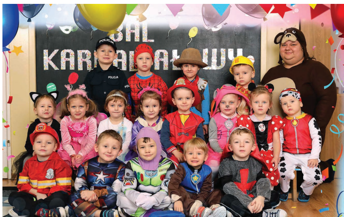
Przedszkole Publiczne w Pierścuku z oddziałami zamiejscowymi w Kowalach