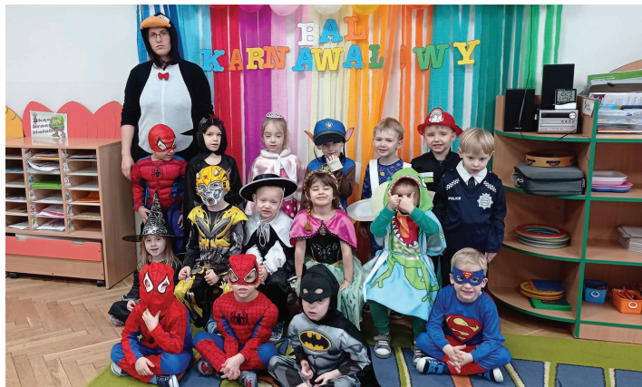
Przedszkole Publiczne nr 1 w Skoczowie

wicie kolorowych strojów... Otrzymaliśmy mnóstwo zdjęć, jednak ze względu na ograniczoną ilość miejsca w gazecie, nie mogliśmy zamieścić wszystkich. Do druku mogły też trafić tylko te w najlepszej jakości. (WP)