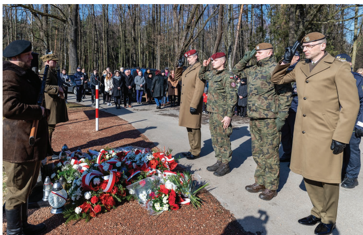
Zdjęcia z archiwum WP