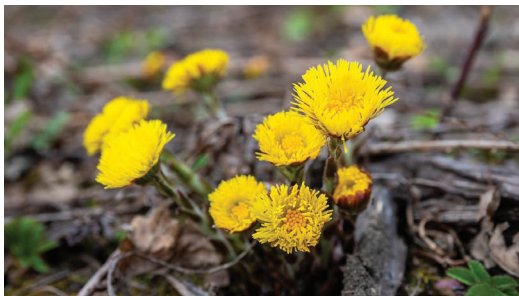
Podbiał pospolity.