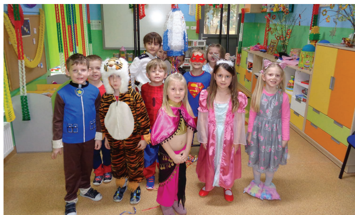
Przedszkole Publiczne w Harbutowicach