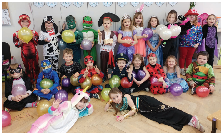
Przedszkole Publiczne nr 1 w Skoczowie