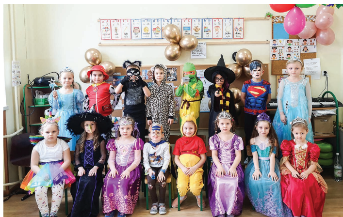
Przedszkole Publiczne w Pogórze