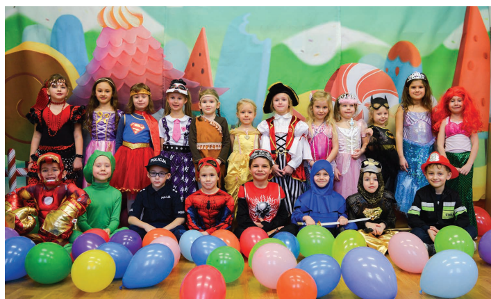
Przedszkole Publiczne w Kiczycach