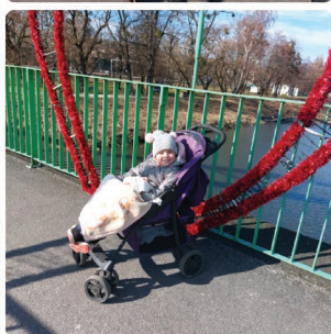
Kolaż zdjęć nadesłany przez Karolinę Zabiegałą