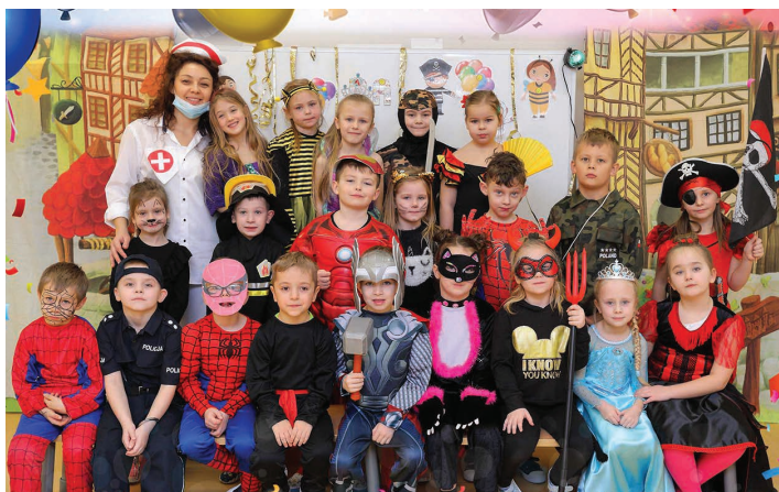
Przedszkole Publiczne w Pierścuku