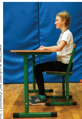
Fot. z publikacji „Na zdalnym w Skoczowie”

Na gimnastykę korekcyjną przychodzą osoby w różnym wieku – obecnie najstarsza ma 16 lat, ale w zajęciach uczestniczyły także 17- i 18-latk. Dziś pod opieką są nawet 4,5-latk. Pojawiła się