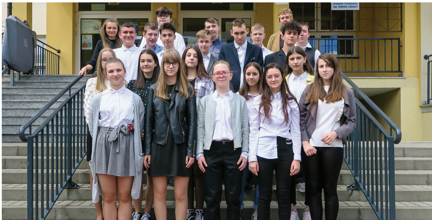
Szkoła Podstawowa nr 8 im. Krystyny Bochenek w Skoczowie