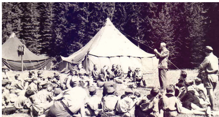
Oboz harcerski w Wiśle, lata 50. XX w.