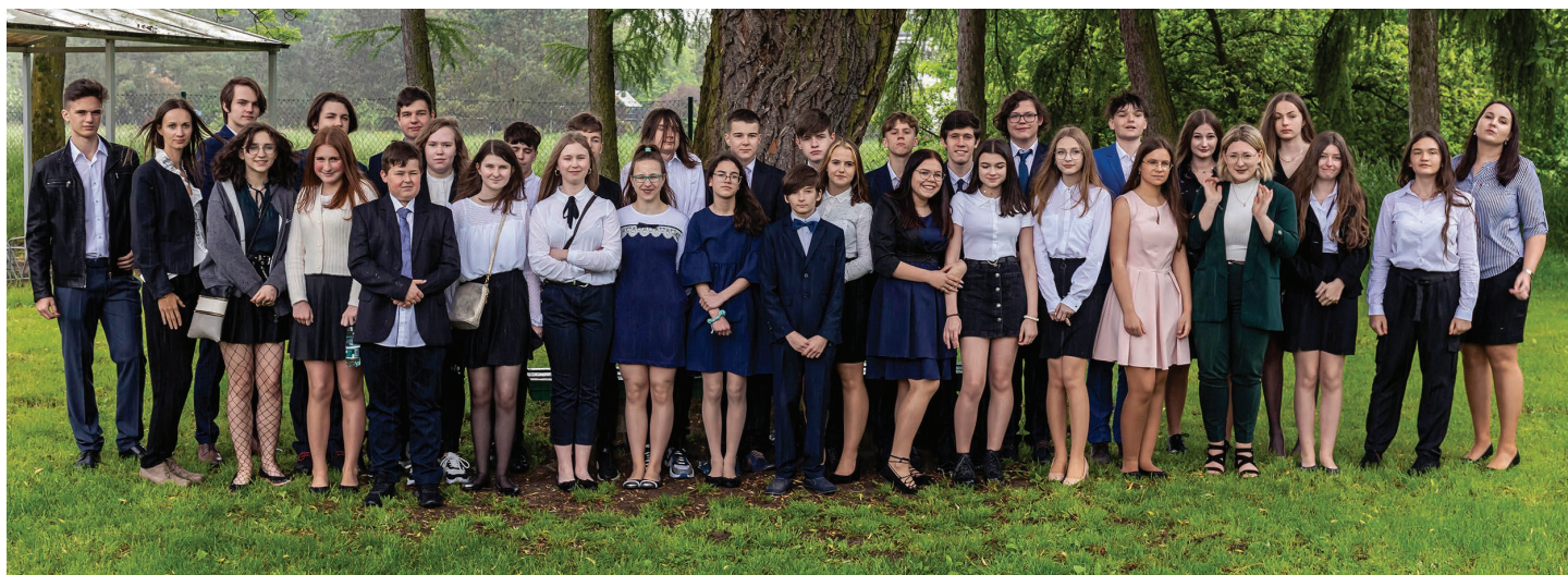
Szkoła Podstawowa im. Karola Miarki w Ochabach