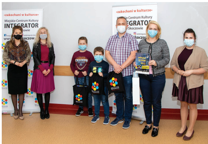
Tekst i zdjęcie: MCK „Integrator”