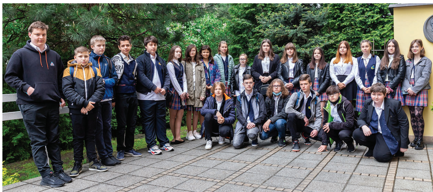
Szkoła Podstawowa nr 3 im. Jana Pawła II w Skoczowie