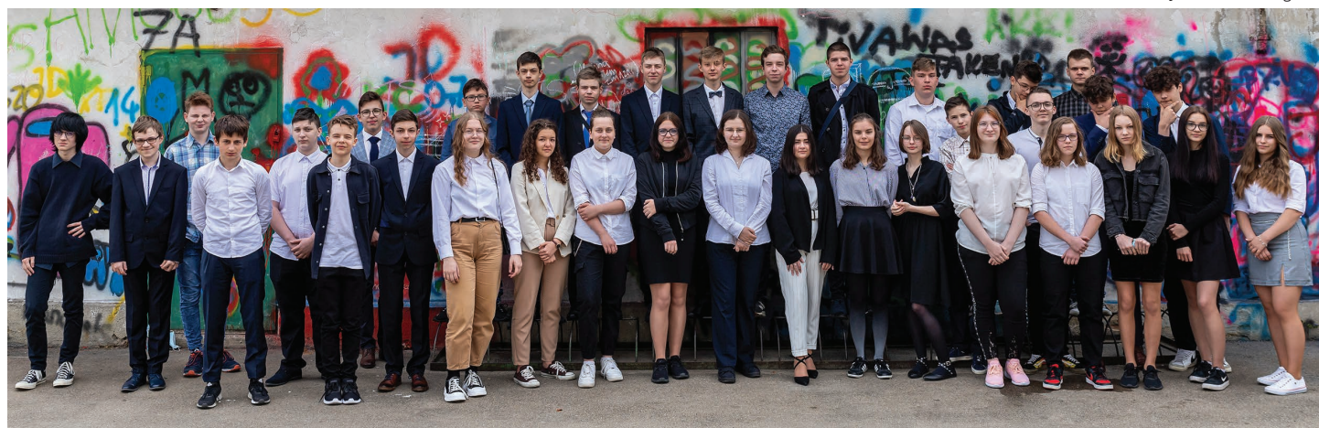
Szkoła Podstawowa nr 1 im. Gustawa Morcinka w Skoczowie