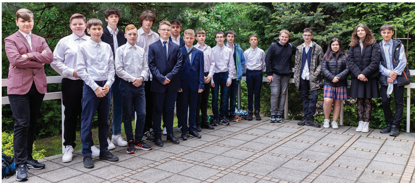
Szkoła Podstawowa nr 3 im. Jana Pawła II w Skoczowie