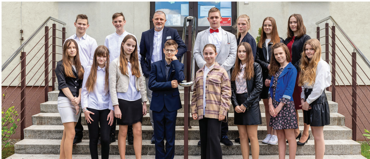
Szkoła Podstawowa im. Orla Białego w Kiczycach