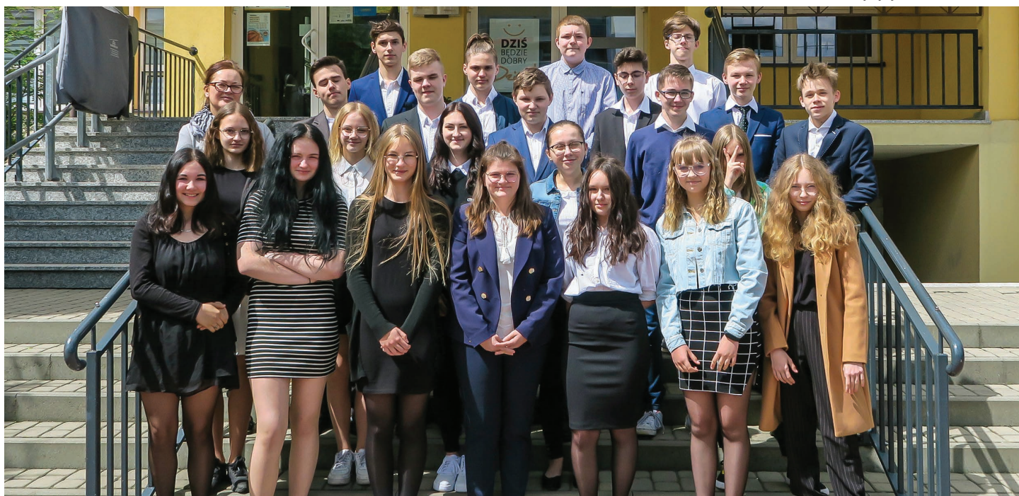
Szkoła Podstawowa nr 8 im. Krystyny Bochenek w Skoczowie