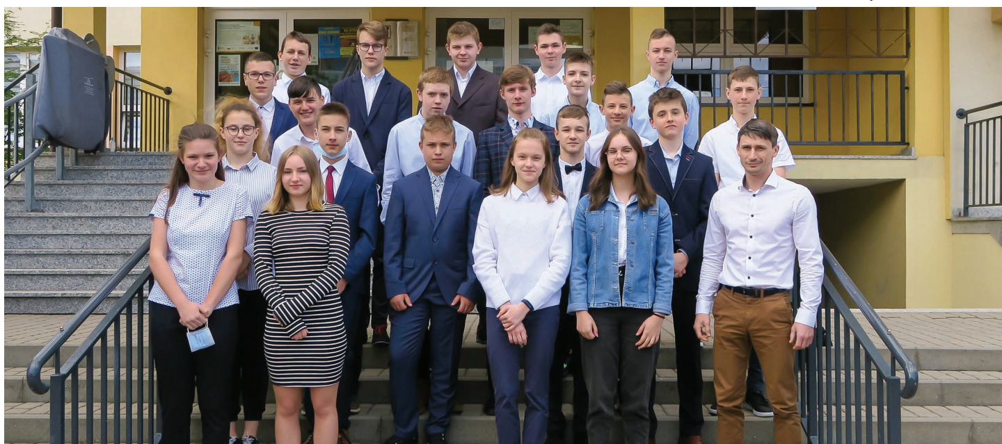
Szkoła Podstawowa nr 8 im. Krystyny Bochenek w Skoczowie