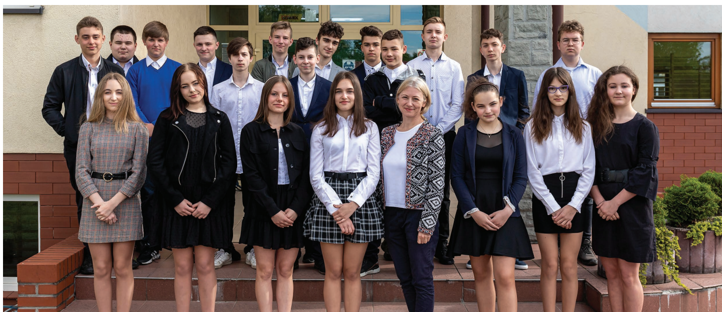
Szkoła Podstawowa im. Zofii Kossak w Pierścicu