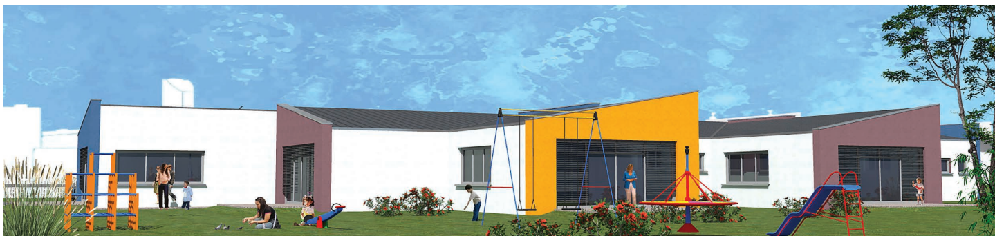
Wizualizacja nowego przedszkola