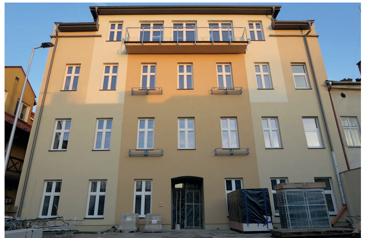
Kamienica Rynek 3 od strony zachodniej

W 2020 roku ruszył nowy rządowy program wsparcia dla samorządów – Fundusz Inwestycji Lokalnych. W skali kraju na program przeznaczono w sumie 6 mld zł. Środki przekraczające kwotę 5 mln zł trafiły na konto gminy Skoczów. Zostały one przeznaczone na pokrycie wkładu własnego dwóch inwestycji – przebudowy kamienicy Rynek 3, która zostanie zaadaptowana na Centrum Edukacji Ekologicznej, a także kompleksową termomodernizację i przebudowę budynków na stadionie miejskim przy ul. Sportowej 6.