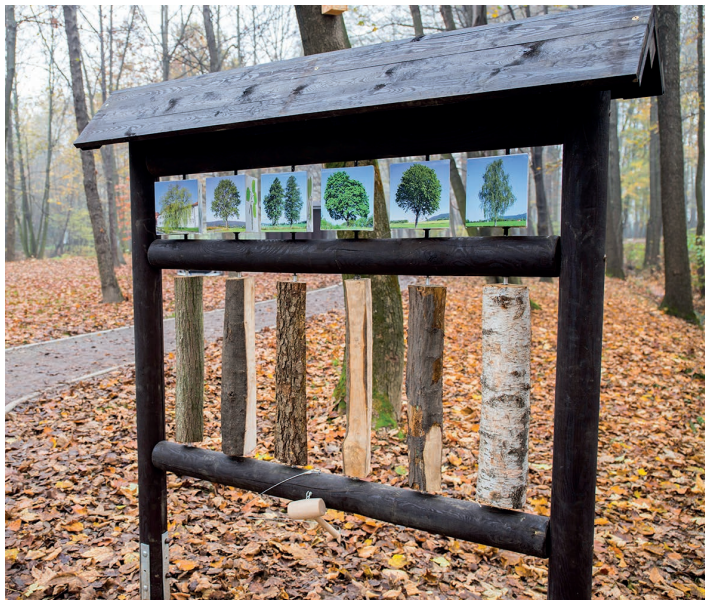
Stanowisko omawiające gatunki drzew

Na Górnym Borze zakończono prace związane z powstaniem nowego parku leśnego. Ich koszt wyniósł ponad 1,8 mln zł. Założenia programu, z którego uzyskano na inwestycję dofinansowanie unijne, przewidywały jak najmniejszą ingerencję w naturalny, dobowy rytm życia fauny i flory. Dlatego ścieżki wykonane są z materiałów naturalnych i nie montowano sztucznego oświetlenia – latarni. W parku znalazły się tablice edukacyjne, ławki oraz budki lęgowe dla ptaków i nietoperzy. Znajdziemy również stację wiatrową i zegar słoneczny. W południowej części parku, w wydzielonym terenie, znajdują się też małe budki lęgowe przeznaczone dla owadów (głównie dla pszczoł samotnic). Wykonano również ok. 1,7 km ścieżek utwardzonych kłębem (prócz miejsc przy planszach edukacyjnych, gdzie ścieżki zostały wybrukowane), alejkę wokół trzeciego stawu oraz nową kładkę nad rzeką Bładnicą. Wiosną i jesienią park z pewnością będzie przyciągał nauczycieli wraz z uczniami. Takie rozwiązanie umożliwia specjalna tablica lekcyjna dostosowana do pisania kredą oraz drewniane ławki. W okresie wiosenno-letnim każdy powinien spróbować spaceru po ścieżce zmysłów – oczywiście boso! Warto jednak cierpliwie czekać na nadejście wiosny, kiedy to w południowej części parku pojawi się przepiękna łąka kwietna.