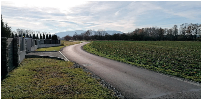
Ul. Trzy Dęby w Bładnicach