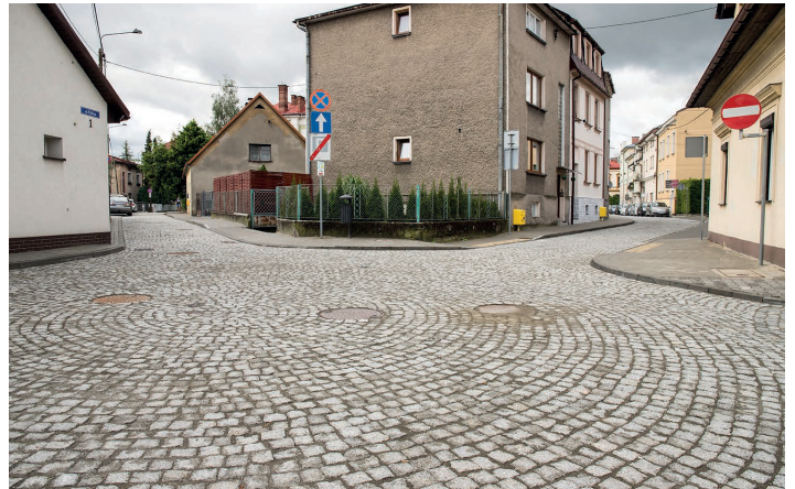
Skrzyżowanie ulic Polnej i Szkolnej

Od września mieszkańcy Skoczowa mogą korzystać z gruntownie wyremontowanych ulic w centrum miasta – ul. Szkolnej, Polnej i Mennicznej w kwocie 1,8 mln zł. W ramach przebudowy wykonano sieć wodociagową i kanalizację deszczową oraz nową sieć energetyczną, a przede wszystkim konstrukcję drogi i chodników. Droga otrzymała nawierzchnię z kostki granitowej. Dotacja z rządowego Funduszu Dróg Samorządowych pokryła 55% kosztów kwalifikowanych inwestycji, czyli ponad 1 mln zł. Zakończyła się również kompletna przebudowa ul. Zofii Kossak-Szatkowskiej o wartości 4,6 mln zł. Kompleksowo zmodernizowano konstrukcję drogi wraz z podbudową i nawierzchnią asfaltową. W ramach inwestycji wykonano również kanalizację deszczową, modernizację sieci wodociagowej, próg zwalniający, oświetlenie przy przejściu dla pieszych oraz urządzenie sygnalizujące prędkość z zasilaniem solarnym. Dofinansowanie z Funduszu Dróg Samorządowych wyniosło ponad 2,5 mln zł.