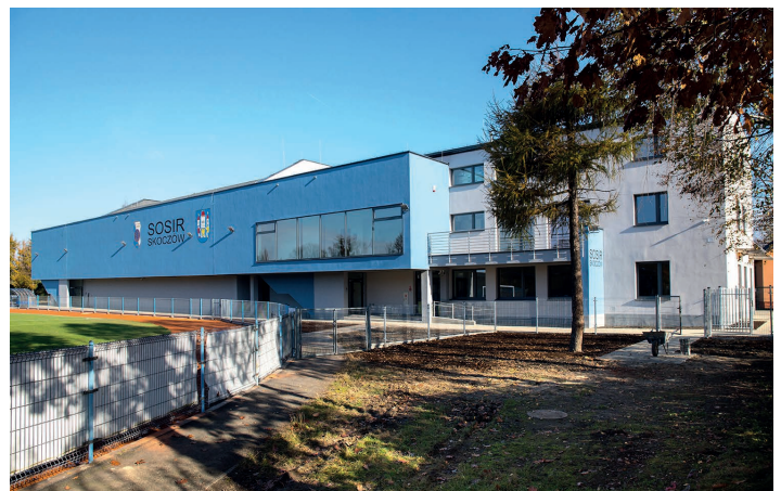
Widok na halę od strony boiska

To kolejna dobra wiadomość dla skoczowian w 2020 roku – zakończyły się prace budowlane w hali sportowej przy stadionie miejskim im. R. Kukucza. Prace zakrojone były na bardzo szeroką skalę, a koszt inwestycji przekroczył sumę 8 mln zł. Całość to ponad 1700 m 2 powierzchni użytkowej, na którą składają się szatnie z toaletami i prysznicami dla zawodników, pomieszczenie przeznaczone dla masażysty, pomieszczenia biurowe i gospodarcze, sala konferencyjna, kawiarenka, pomieszczenia przeznaczone na siłownię i saunę oraz sama hala. W hali sportowej powstała widownia, która pomieści ponad 200 kibiców – część trybuny może być składana. Na sektory dla publiczności prowadzą osobne wejścia, wykonano również toalety dla kibiców. Budynek jest wyposażony w nowoczesną instalację fotowoltaiczną, klimatyzację pomieszczeń biurowych, gazowe centralne ogrzewanie oraz system wentylacji mechanicznej hali sportowej. Najważniejszy etap, czyli prace budowlane w skoczowskiej hali, został zakończony. W przyszłym roku budynek zostanie doposażony.