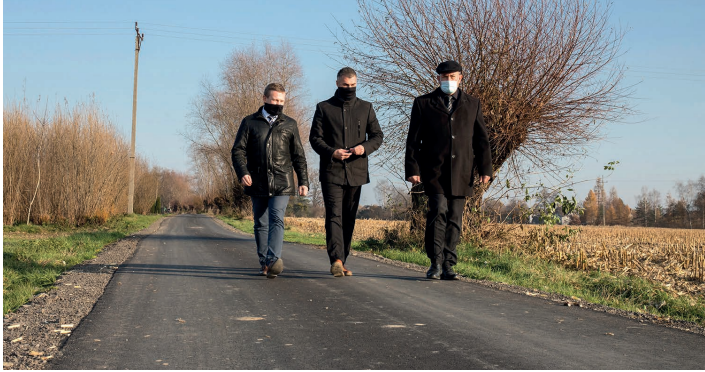
Odbiór ul. Cesarskiej w Ochabach

W tym roku remonty na drogach gminnych prowadzone były w ramach drugiej części programu tzw. Funduszu Nakładkowego, nadzorowanego przez MZD w Skoczowie. W sumie wykonano remont aż 20 odcinków dróg, których łączna długość wyniosła ponad 7,5 km. Remonty odbywały się w kolejnych pięciu sołectwach: w Bładnicach na ul. Trzy Dęby i Gazdowskiej; w Międzywiciu na ul. Rogowej, Blokowej i Paproci; w Harbutowicach na ul. Zachodniej i Bajkowej; w Wiślicy na ul. Północnej i Wolności; w Ochabach na ul. Kameralnej, Młyńskiej, Sołtysa L. Lebiody, Podwale, Cesarskiej, Familijnej, Przyjaźni i Kępy. Remonty odbywały się również na drogach gminnych w Skoczowie – na ul. Ceglanej, Kolorowej, Zacisze, a także na drodze bocznej od ul. Wiślickiej. Koszt tegorocznych prac wyniósł łącznie 2 mln zł. W ciągu dwuletniego cyklu programu tzw. Funduszu Nakładkowego zostały wyremontowane 33 odcinki dróg gminnych o łącznej długości 14 km.