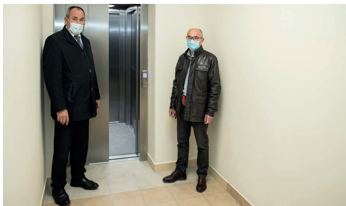
Odbiór nowo wybudowanej windy w SP w Pierścisku

każdego ucznia w życiu szkoły. Co prawda, na ten cel nie udało się uzyskać dofinansowania z PFRON-u, ale równy dostęp do nauki jest dla gminy Skoczów niezwykle istotny, dlatego zadanie to zostało w całości zrealizowane z budżetu gminy.