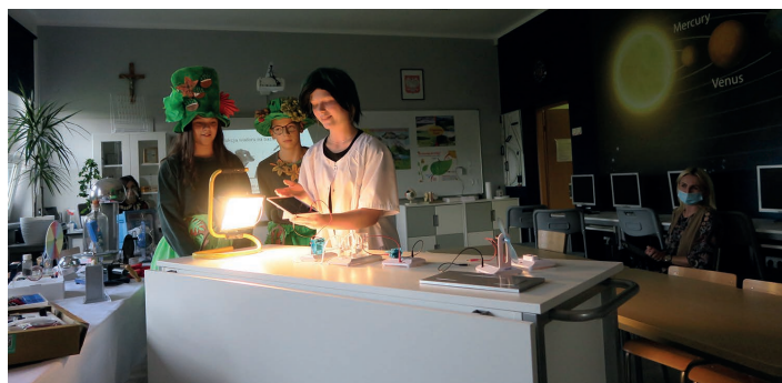
Oficjalne otwarcie pracowni

z Wojewódzkiego Funduszu Ochrony Środowiska i Gospodarki Wodnej w Katowicach. Łącznie szkoła zdobyła prawie 37 500 zł, czyli całkowitą kwotę przeznaczoną na tę inwestycję.