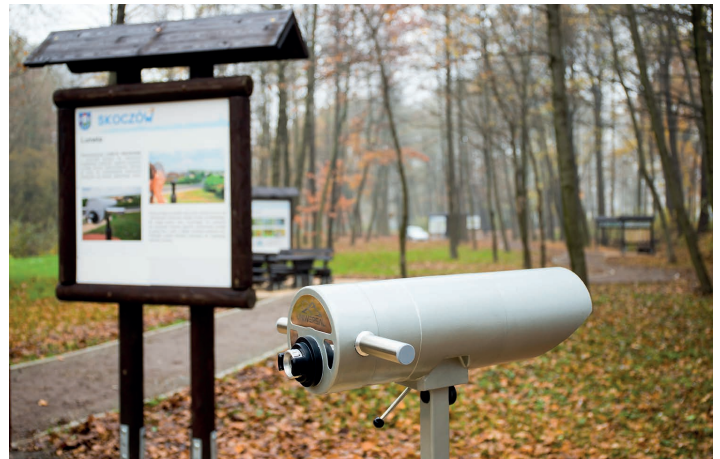
Luneta do obserwacji ptaków w parku