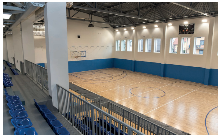
Wnętrze hali – widok z trybun