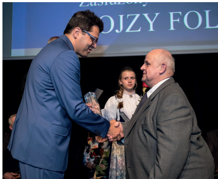
Zdjęcie wykonane podczas wręczenia statuetki „Zasłużony dla Skoczowa” w 2018 r.

– Dziękujemy za rozmowę. Jeszcze raz serdecznie gratulujemy uhonorowania Laurem Srebrnej Cieszynianki.