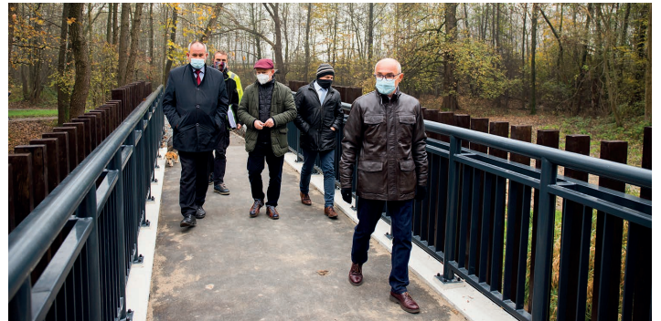
Nowa kładka nad rzeką Bładnicą

Każdy powinien spróbować spaceru po ścieżce zmysłów – szczególnie latem, kiedy aż korci, by zdjąć buty i pobiegać bosą. Drzewa pozwalają oddychać pełną piersią, a jak je od siebie odróżnić, przybliży przystanek. Kawałki drewna zamontowane w specjalnych stojakach nie tylko pozwalają poznać kolor drewna z danego gatunku drzewa, poznać strukturę kory, ale również usłyszeć dźwięk, jaki wydaje drewniany kłoc uderzony