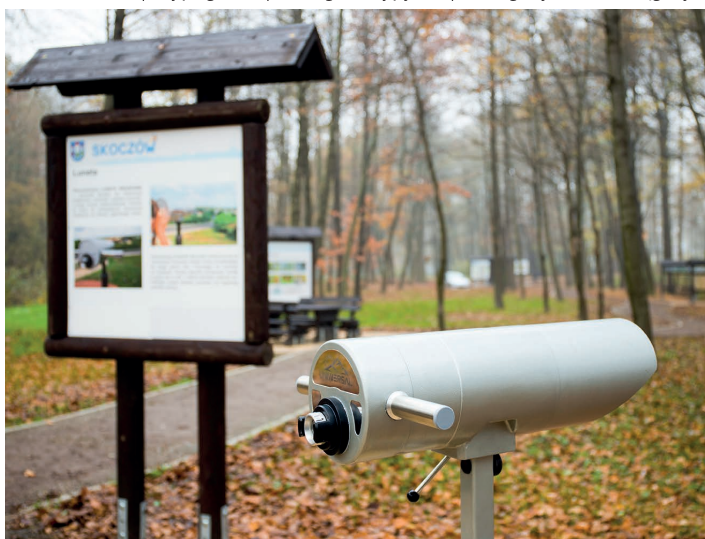
Luneta do obserwacji ptaków w parku