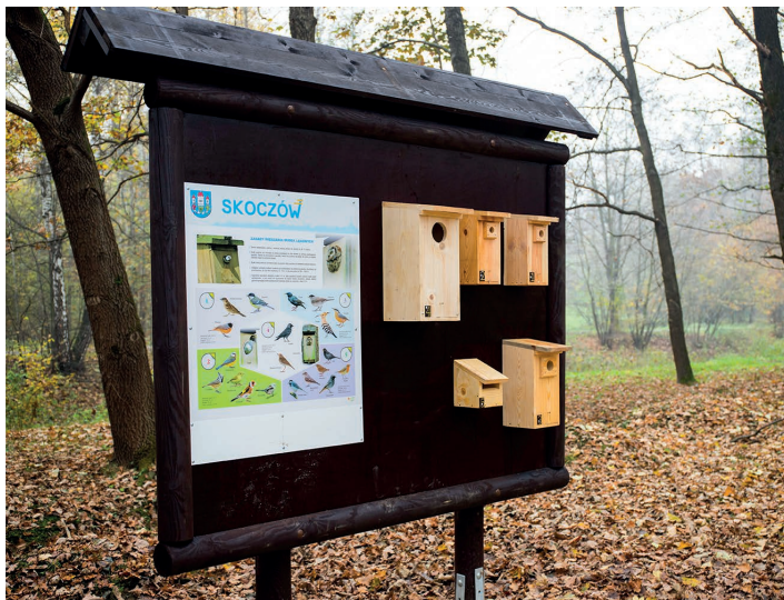
Tablica opisująca gatunki ptaków gniazdujących w poszczególnych budkach lęgowych