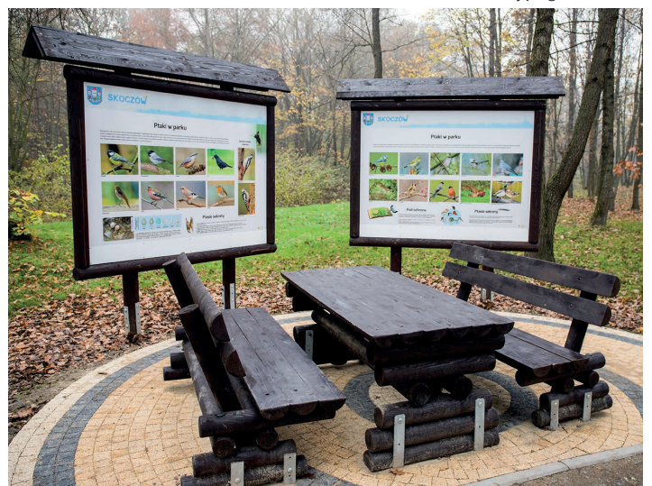
Tablice edukacyjne opisujące gatunki ptaków