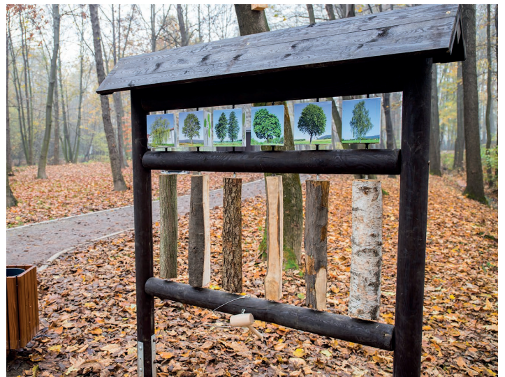
Stanowisko omawiające gatunki drzew