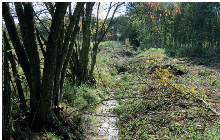
Aktualnie spółka wodna prowadzi prace nad udrożnieniem rowu w Międzywiedu w okolicach ul. Beskidzkiej

Karol Kojma: Chciałbym, żeby mieszkańcy zrozumieli, że mogą, a nawet powinni konsultować swoje inwestycje ze spółką wodną. Wystarczy tylko tyle, by uniknąć późniejszych kłopotów. Warto również zwracać uwagę na miejsca, w których prowadzą nasadzenia drzew i krzewów, na przykład tui czy wierzb. Ich korzenie łatwo wrastają w systemy drenarskie, co powoduje ich zamulanie, brak odpływu wody, a w konsekwencji zalewanie gruntów. Uważać trzeba też podczas wykonywania ogrodzenia działki. Konsultacje podjęte w odpowiednim momencie to zadanie, które powinno ciążyć na inwestorach – dotyczy to na przykład budownictwa