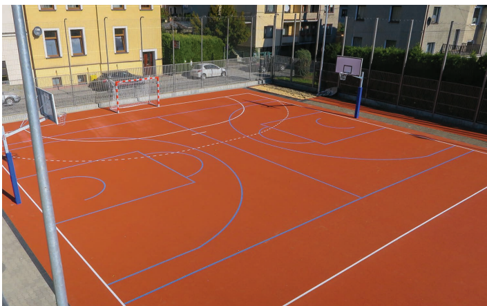
Zdjęcia z archiwum WP

Teraz na bezpiecznej nawierzchni można grać w piłkę nożną i ręczną, koszykówkę i siatkówkę. Obok boiska powstała również bieżnia i skocznia do skoku w dal. Wybudowane zostały nowe piłkochwyty i ogrodzenie. Zamontowano oświetlenie w technologii LED oraz elementy małej architektury – ławki, kosze i stojaki na rowery. Całość inwestycji to koszt ponad 600 tys. zł. (WP)